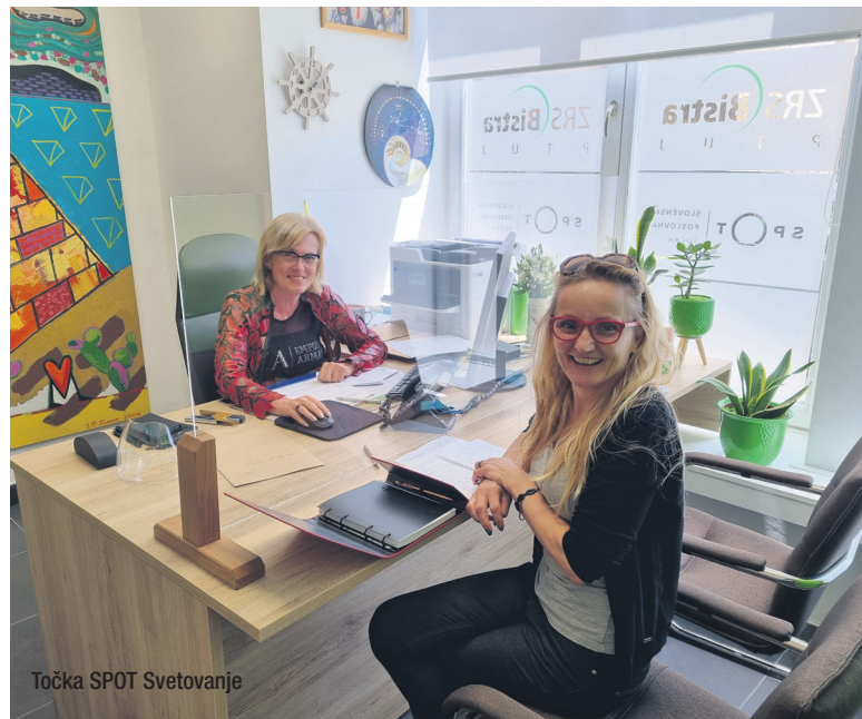
Točka SPOT Svetovanje

Največji del vlaganj je bil namenjen področju okoljske infrastrukture z namenom varovanja podtalnice in izvirov pitne vode. Sledijo vlaganja v prometno ter investicije v turistično in kulturno infrastrukturo . Tudi energetska sanacija javnih stavb ter novogradnja in obnova vrtcev je pripomogla k obogatitvi infrastrukture. Področje spodbujanja podjetništva in konkurenčnosti pa se odraža v novi izgrajenih obrtnih in poslovnih conah .