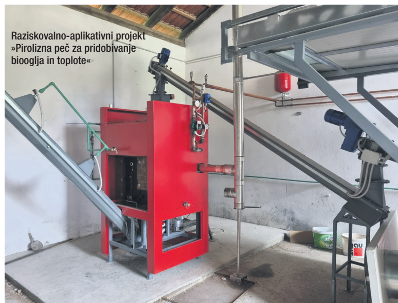
Raziskovalno-aplikativni projekt »Pirrolizna peč za pridobivanje bioogljja in toplote«

ZRS Bistra Ptuj kot znanstveno-raziskovalna institucija s koncesijo za izvajanje javne službe na področju raziskovalne dejavnosti deluje v smeri ustvarjanja novih znanj na raziskovalnih področjih kemijskega in procesnega inženirstva, krožnega