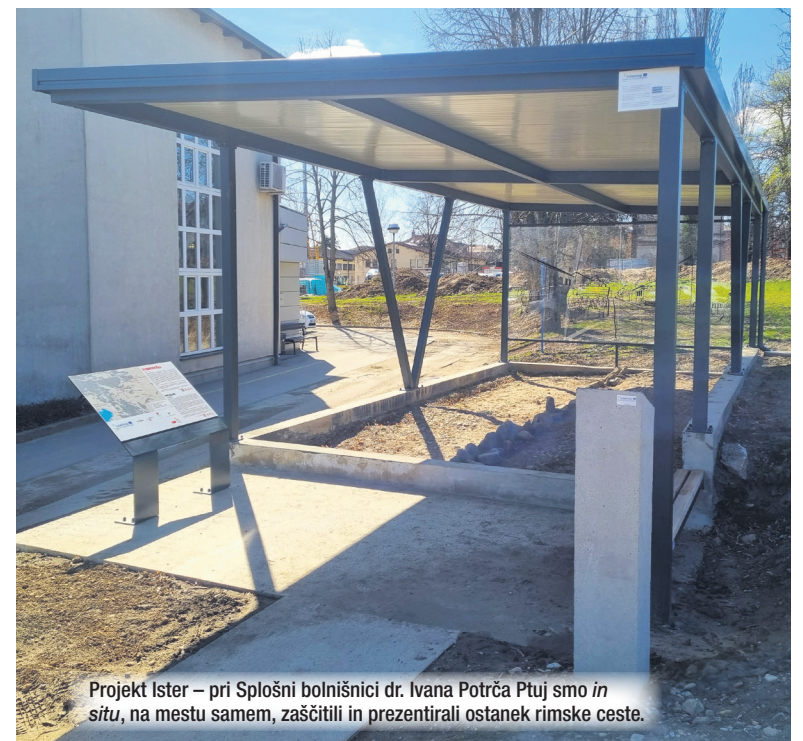
Projekt Ister – pri Splošni bolnišnici dr. Ivana Potrča Ptuj smo in situ , na mestu samem, zaščitili in prezentirali ostanek rimske ceste.

gospodarstva in sonaravnih rešitev za prilagajanje podnebnim spremembam. Znanstvene in aplikativne interdisciplinarne raziskave zaokrožamo z razvojem kadra od regionalnega mladinskega raziskovanja do mladih raziskovalcev doktorantov. Za razvoj in uvajanje novih znanj v gospodarsko prakso se pri svojem delu povezujemo s fakultetami in raziskovalnimi inštituti na več področjih.