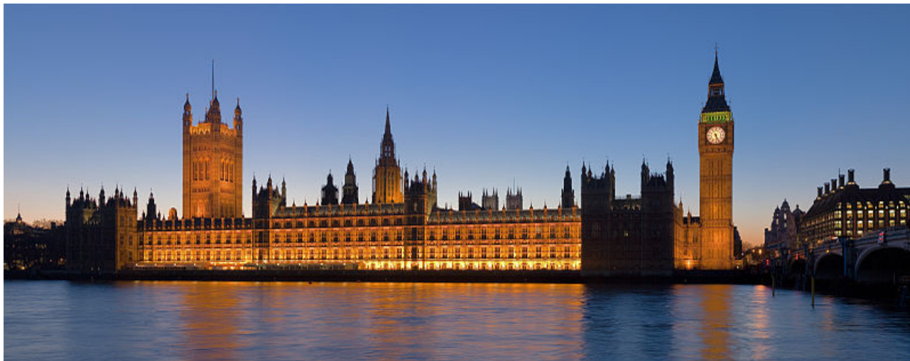
Slika 8: Westminsterška palača - sedež obeh domov parlamenta. (David Iliff, 2007)

britanskega monarha je tudi pošiljanje čestitk podanikom, ki dosežejo 100. rojstni dan ali diamantno poroko. Britanski monarh je tudi vodja britanskih oboroženih sil ter varuh vere. 40