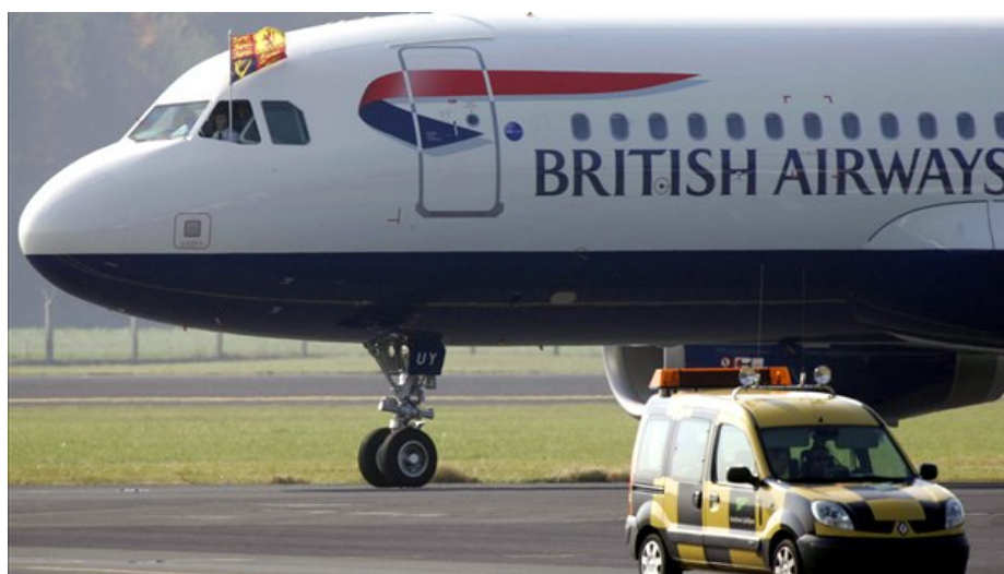
Slika 11: Prihod letala z britansko kraljico v Slovenijo.