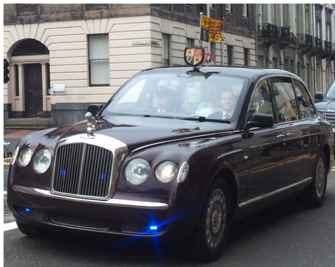
Slika 7: Kraljevi bentley. (Vir: Wikipedia)

Kraljico pripeljejo na uradne dogodke po navadi v državniškem bentleyu, ki ji je bil podarjen leta 2002. Kraljica je lastnica bogate zbirke britanskih avtomobilov, v katerih so vozili njo in njene predhodnike. V uporabi kraljeve družine so večinoma avtomobili britanskih proizvajalcev, kot so Land Rover, Bentley, Rolce Royce, Aston Martin, Jaguar. Ko je v avtomobilu kraljica, je na strehi avtomobila po navadi izobešen kraljevi prapor. Pomembno vlogo pri varovanju imajo predvsem avtomobili Ranger Rover, podjetja Land Rover, ki so skoraj vedno vključeni v varnostne kolone članov kraljeve družine. Cena varovanja ni vključena v prej omenjene vire financiranja in jo poravnava država. Avtomobili, kot so državniški bentley, ne potrebujejo registrskih tablic. Znano je, da pred uporabo tega avtomobila zamenjajo plastiko, ki je na sprednjem delu avtomobila (logotip bentleya), s svetim Jurijem, ki se bori z zmajem, na Škotskem pa z levom.