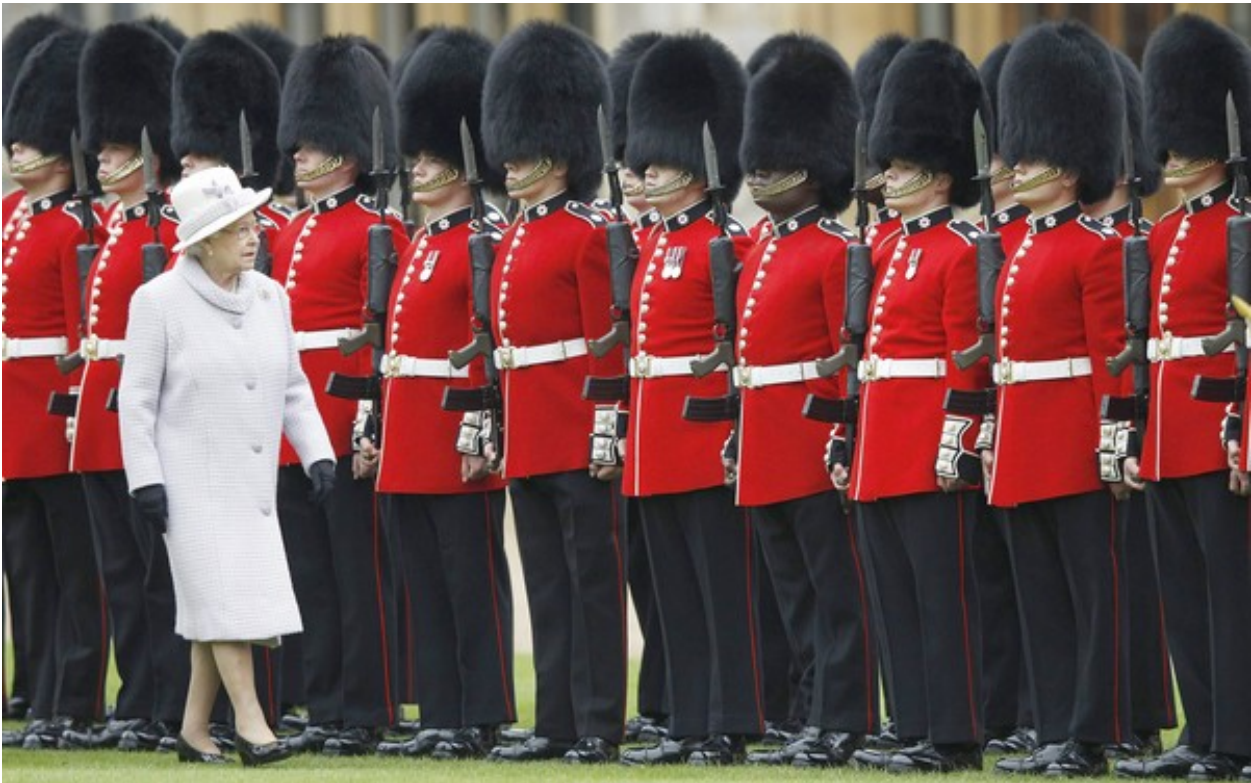
Slika 13: Kraljica ob pregledu straže.

Kraljičin ded, kralj Jurij V., je pričel s tradicijo božičnih nagovorov ljudstvu leta 1932, nadaljeval jo je tudi Jurij VI. Božičnega govora ne napiše vlada - napišejo ga monarhove službe ali monarh sam. Od leta 1957 so govori predvajani na televiziji. Leta 2012 je bil govor prvič posnet tudi v 3D tehnologiji. 49