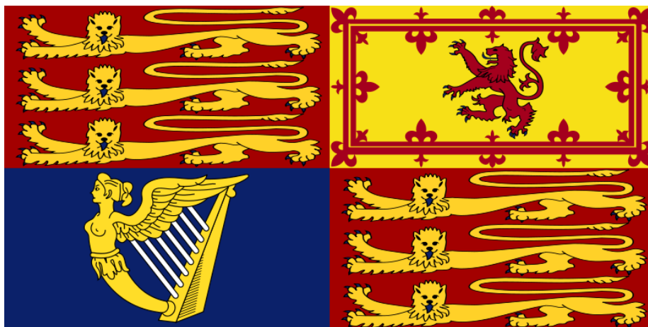
Slika 4: Kraljevi prapor Združenega kraljestva.

V uporabi je več praporov, celo posamezni člani kraljeve družine uporabljajo različne prapore, glede na lokacijo, kjer se nahajajo. Najpogosteje je v uporabi kar kraljevi prapor Združenega kraljestva, zato bom predstavil tega.