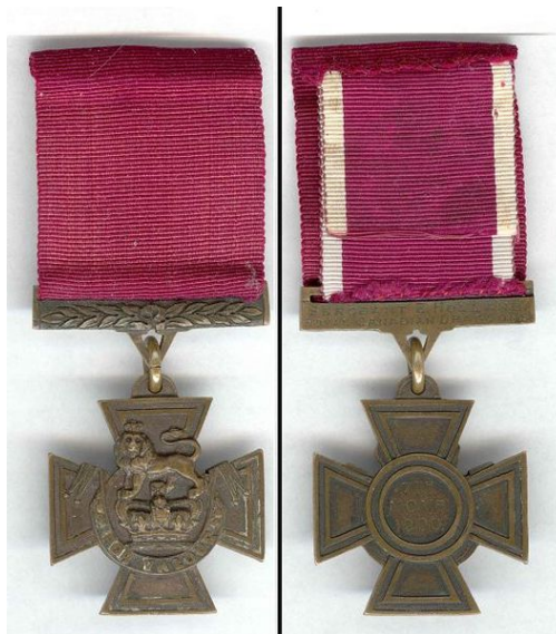
Slika 10: Viktorijin križec.

Naslednje visoko vojaško odlikovanje je Jurijev križec (George Cross - GC), ki ga podeljujejo od leta 1940. Nato sledijo še druga odlikovanja, kot so vitez velikega križa, reda Bath, sledi mu red Merit, temu sledi odlikovanje viteštva velikega križa Britanskega imperija, itd. Odlikovanj je še veliko več, vsako prinaša določene pravice (vsak prejemnik ima tako pravico do uporabe ustreznih kratic za imenom).