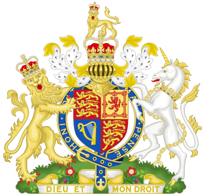
Slika 5: Kraljevi grb.