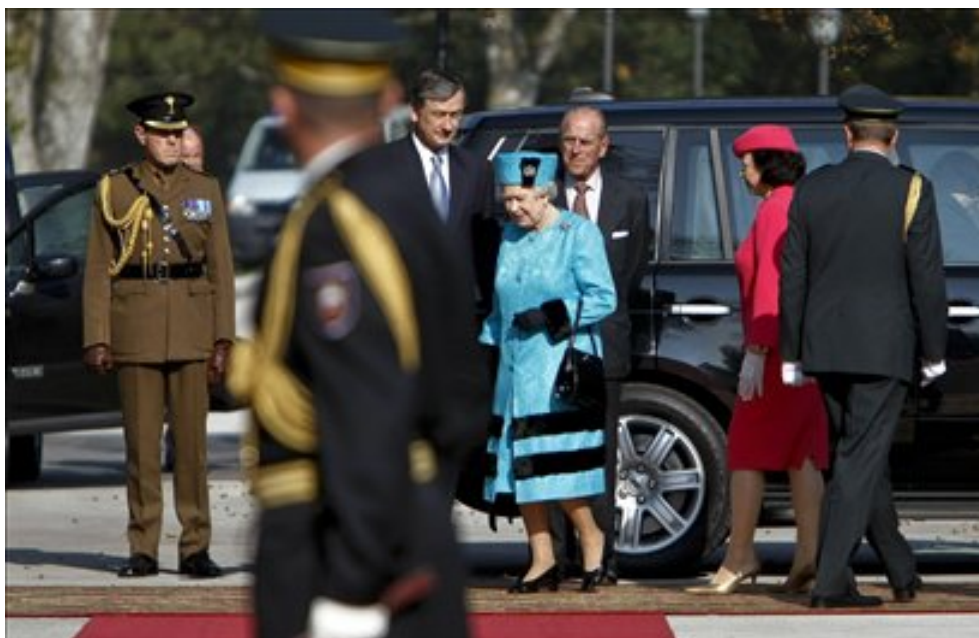
Slika 12: Prihod britanske kraljice v Slovenijo.