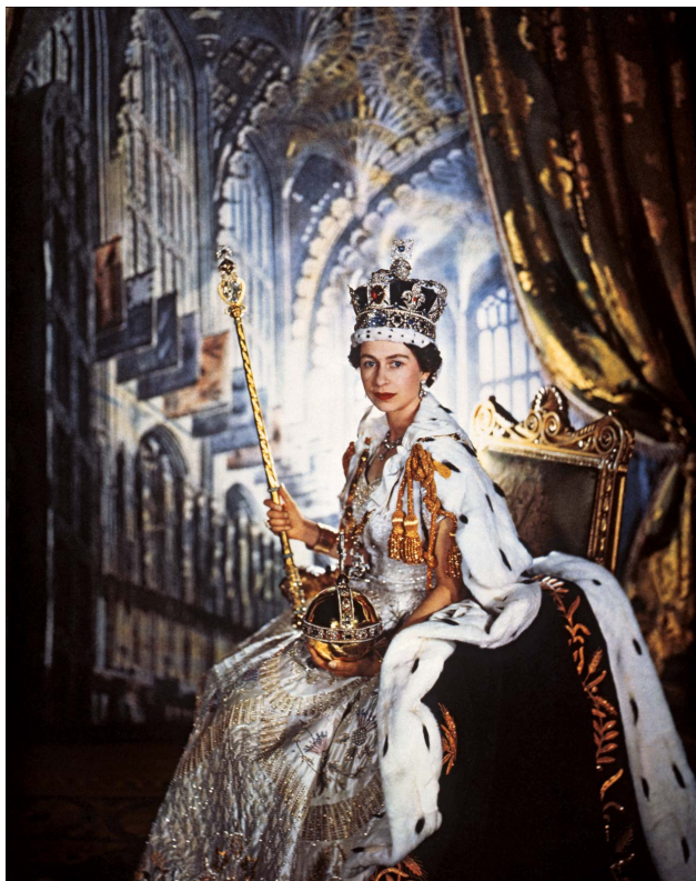
Slika 3: Okronana kraljica Elizabeta II.

Zadnji tak banket je bil izveden leta 1821, Viljem IV. je bankete odpravil. Leta 1953 banket prav tako ni bil organiziran, je pa bila ustvarjena neuradna jed, Coronation Chicken (jed s piščancem), ki je bila postrežena gostom. 15