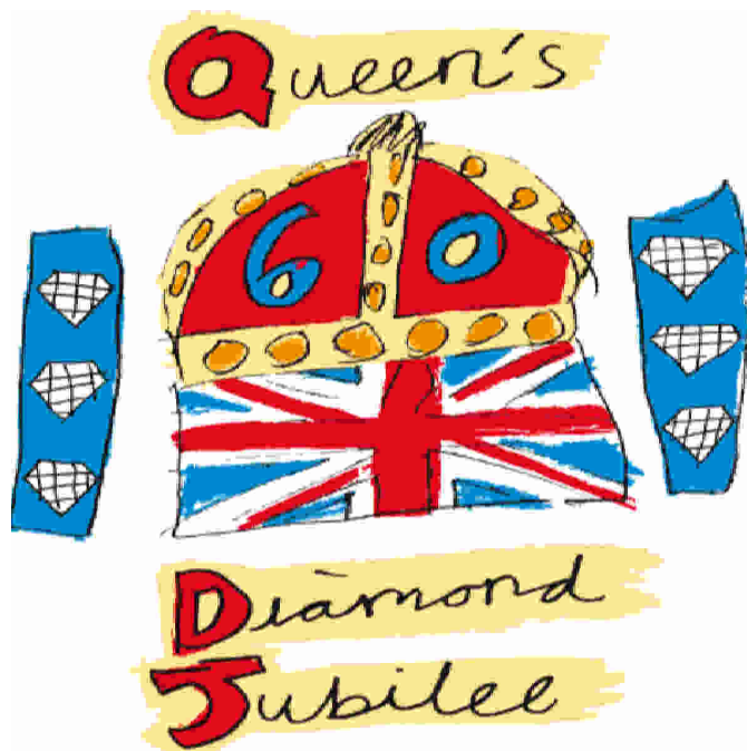
Slika 6: Logotip diamantnega jubileja.