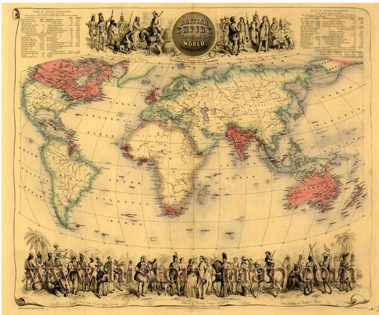
Slika 1: Britanski imperij v času kraljice Viktorije.

Kraljevati je naporno, monarh je vedno na očeh javnosti, držati se mora dokaj strogega protokola, obišče veliko krajev in prireditelj. V Veliki Britaniji pa je postal še "turistična znamenitost". Postavlja se vprašanje, ali Velika Britanija morda celo zasluži z vzdrževanjem inštitucije, kot je kraljevina. Na to vprašanje seveda ne bom odgovarjal jaz, v majhen razmislek je lahko že dejstvo, da se skoraj vsak turist vrne domov s spominkom, ki je nekako povezan s kraljevo družino. The Guardian je poročal o predvidenih prodajah spominkov v višini do kar 823 milijonov funtov. 5