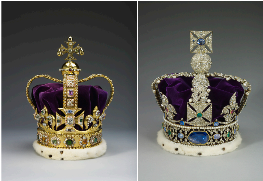
Slika 2: Krona sv. Edvarda (levo) in državna imperialna krona (desno).

Zadnji del kronanja je imenovan "homage", kar bi lahko prevedli kot poklon ali zaobljuba monarhu. Najprej se poklonijo cerkveni predstavniki, nato člani kraljeve družine, pozneje pa še predstavniki plemstva v imenu le-tega.