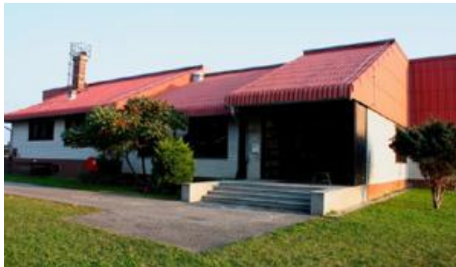
Slika 2: OŠ Lovrenc – pred obnovo

OŠ Lovrenc je skozi zgodovino izgubila svoj pomen. V kraju so leta 1964 zgradili novo šolo, ki je podružnica osnovne šole v Kidričevem. Šola obsega prvih pet razredov osnovne šole, potem pa se učenci prešolajo v Kidričevo; izjemoma tudi v OŠ Cirkovce. V šoli je pet učilnic, garderoba, zbornica, knjižnica, kuhinja in jedilnica, ki stoji v avli. Vse učilnice so sodobno opremljene, saj ima večina učilnic pametne table. Konec leta 2013 pa se je pričela obnova zgradbe, ki je dobila sodobno izolacijo ter novo stavbno pohištvo.