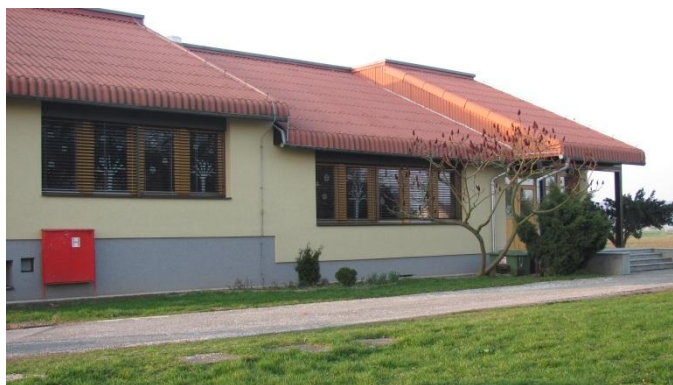
Slika 3: OŠ Lovrenc – po končani obnovi

V šoli se je v preteklosti šolalo največ 140 učencev. Trenutno šolo obiskuje 40 učencev, za katere poskrbijo 4 učiteljice razrednega pouka in učiteljica podaljšanega bivanja. Otroci prihajajo iz Apač, Lovrenca, Župečje vasi ter Pleterij. Za vse učence je organiziran prevoz. V šolskem letu 2009/2010 se je pričela zaradi majhnega števila učencev izvajati kombinacija. Trenutno se izvaja kombiniran pouk v 1. in 2. razredu ter v 4. in 5. razredu. Pouk poteka od 7.30 do 13.50. V preduri oz. po zaključenem pouku imajo učenci podaljšano bivanje ter različne interesne dejavnosti oz. krožke. V okviru tega imajo otroški pevski zbor, računalniški krožek, likovni krožek, šolsko skupnost, zdrav življenjski slog ... V ta namen je šola odprta od 7.00 do 16.00 (Publikacija, 2013/2014).