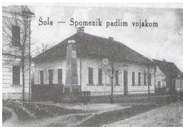
Slika 1: Šola Lovrenc – nekoč

Leta 1879 so zgradili enonadstropno šolsko poslopje, nato je šola postala dvorazredna. Občina je šoli dala tudi zemljišče, kjer so uredili vrt, kjer so se učenci učili kmetovanja. Šola se je kmalu razvila in imela pet razredov. Šolsko stavbo so leta 1904 prenovili (Hernja Masten, 2010).