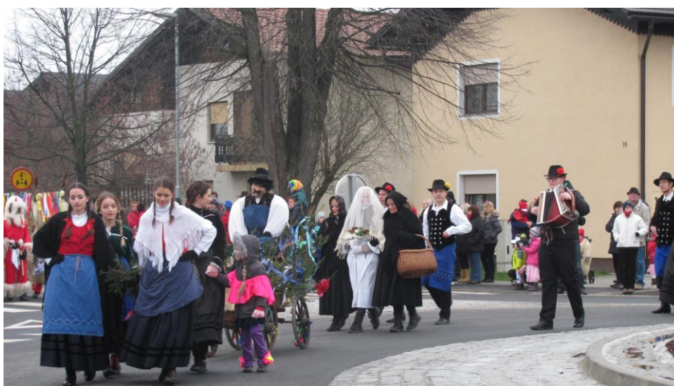
Slika 1: Vleka ploha

»Nes je prišo tisti veliki den, ko mi cirkovski pjebi no deklina jemljemo slovo od tebe no tvojega ledig stana. Duge lete si nam bla dobra prijateljca, vse do tistega cajta, ki si se prvokrat zatreskala v sosedovega Francla. Toda lubezn je bla res velka, saj te je že po 14-ih dneh pustu. Za jim je prišlo na vrsto po celi ducat Onzkov, Šimetov, Tevžov, Jurijov, no drugih pjevov, ki so se do nešjega dneva že vsi vženili pred oltarom svete device Marije Cirkovške , pa noben na srečo s tebi. Ti pa si samo čakala no čakala, to kar si rez dočakala. Dobra boš tudi ti svojega ženina, našiga lubiga Onzeka. Nocoj, na tvojo poročno noč, boš celo noč poleg jega spala, vjutro pa se nedoteknjena vstala. Mi pjebi no deklina pa ti vošmo dosti sreče (Brglez, 2014).