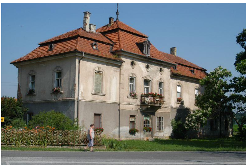
Slika 2: Grad Šterntal – pred obnovo