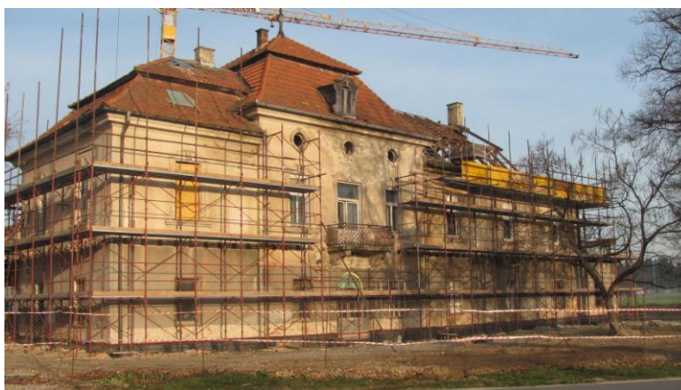
Slika 3: Obnova gradu Šterntal