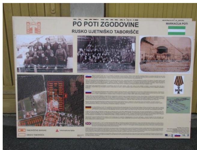
Slika 4: Zgodovinska tabla št. 8

Vseh tabel bo 10. Na tabli št. 1 bo informativni opis poti, zemljevid ter zanimivosti ob njej. Na tabli št. 2 bo opisana zgodovina dvorca Sternthal ter opis rezervne vojaške bolnišnice Klatovy, v kateri so po I. svetovni vojni bivali ruski kadeti. Na tabli št. 3, ki bo stala na Kopališki ulici, bo opis in zgodovina rezervne vojaške bolnišnice Haliz ter opis razvoja naselja Kidričevo po II. svetovni vojni. Na tabli št. 4 bo predstavljeno kopališče, ki je obstajalo že pred I. svetovno vojno za potrebe avstro-ogrskih vojakov. Na tabli št. 5, ki bo stala na Tovarniški cesti, bo opis rezervne vojaške bolnišnice Mlada Boleslav, del table pa bi opozarjal na bližino taborišča iz II. svetovne vojne. Na tabli št. 6, ki bo stala na vojaškem kopališču, bo zapisano, da so tam pokopani tudi begunci iz časa po I. svetovni vojni. Na tabli št. 7 bo opis rezervnih vojaških bolnišnic Sanok in Lukavac. Obe bolnišnici sta stali v bližini železniškega prehoda v Njivercah. Na tabli št. 8, ki bo stala na koncu Kajuhove ulice, bo prikazano, da je na tej lokaciji med I. svetovno vojno stalo ujetniško taborišče, namenjeno za ruske ujetnike. Tabla št. 9 bo opozarjala na rezervno vojaško bolnišnico Dunaj XIX in Kutna gora z delavnicami. Na zadnji tabli, ki bo stala tik ob dvorcu Sterntal, bo opis spomenika iz I. svetovne vojne in opis dvorca Sterntal (Pulko, 2013).