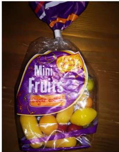
Slika 2: Bonboni Mini Fruits. (Štern, 2017)

Mini Fruits bonboni vsebujejo naslednje aditive: