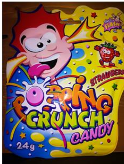
Slika 3: Bonboni Popping Crunch Candy. (Štern, 2017)

E414 – gumi arabikum, E100 – kurkumin, E120 – karminska kislina, E132 – indikotin, E141 – bakrov kompleks, E153 – rastlinsko oglje, E160a – karoten.