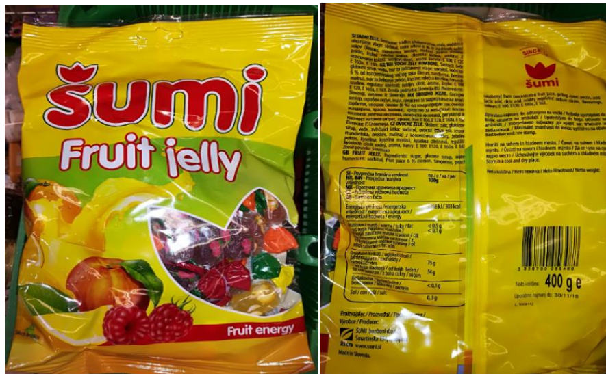
Slika 6: Bonboni Šumi Fruit jelly. (Štern, 2017)

Šumi Fruit jelly bonboni vsebujejo naslednje aditive: