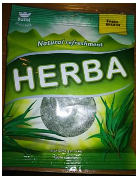
Slika 4: Bonboni Herba. (Štern, 2017)

Herba bonboni vsebujejo naslednja aditiva: