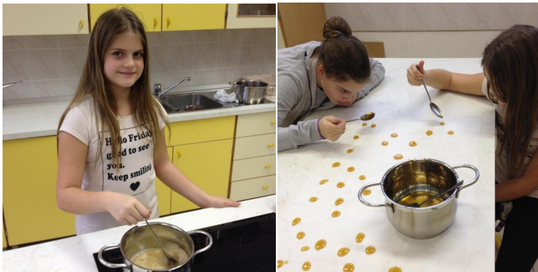
Slika 10: Izdelovanje žajbljevih bonbonov. (Štern, 2018)

Sestavine za pripravo žajbljevih bonbonov sva izbrali zato, ker imava radi limono in ker žajbelj pomaga pri bolečinah v grlu.