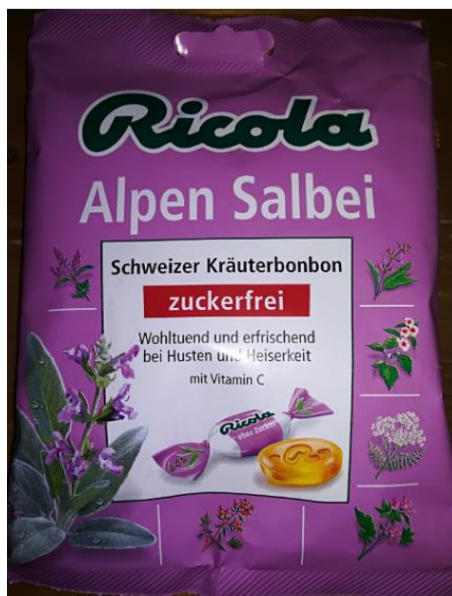
Slika 5: Bonboni Ricola Alpen Salbei. (Štern, 2017)

E141 – barvilo (bakrov kompleks klorofil a).