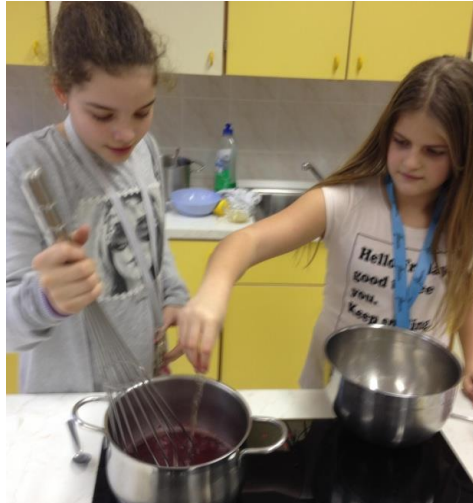
Slika 8: Kuhanje sadnih žele bonbonov. (Štern, 2017)