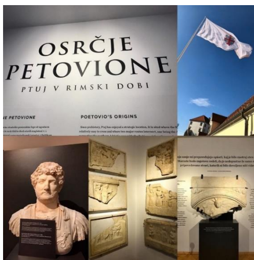
Slika 11: Razstava Osrčje Petovione .