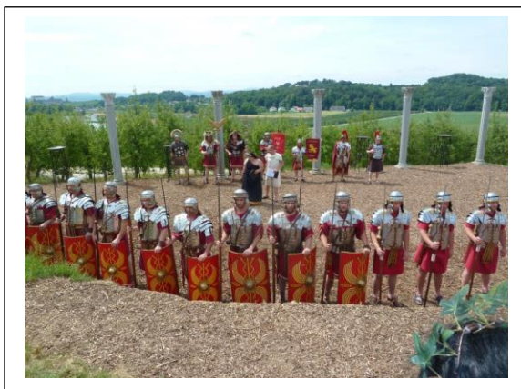
Slika 1: Rimski kamp na Štukih.

(Aplikativni inovacijski predlogi in projekti)