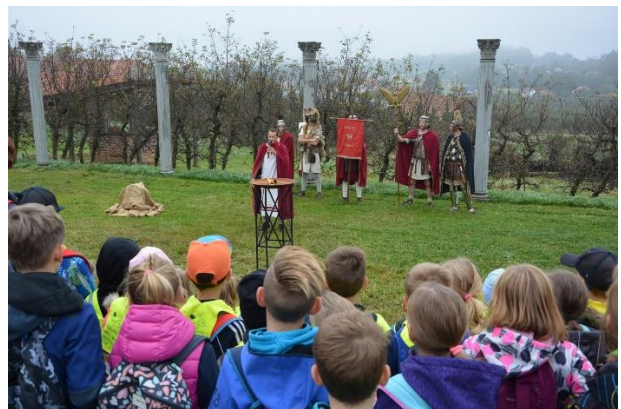
Sliki 17 in 18: Pozdrav v rimskem kampu Poetovio s strani vojakov in Klasusa..