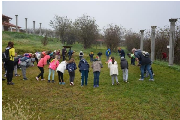
Sliki 40 in 41: Učenci med rimskim plesom.