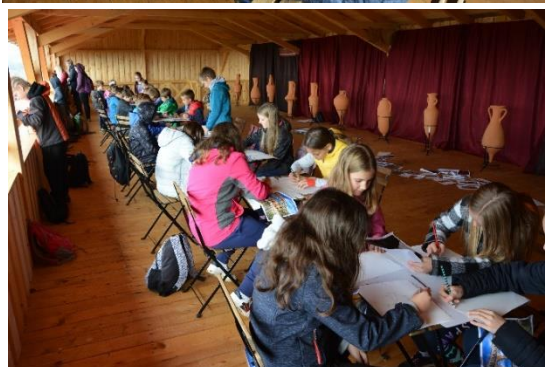
Slike 23, 24, 25 in 26: Slikanje rimskih motivov z ogljem in svinčnikom..