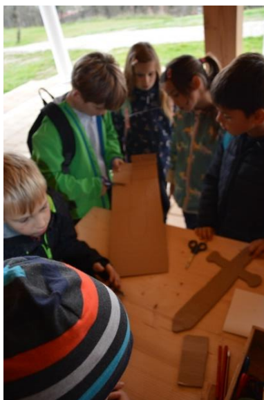
Slika 42: Izdelovanje mečev iz kartona.