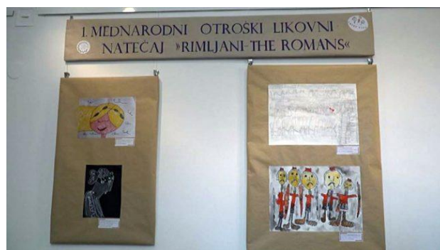
Slika 6: Mednarodni otroški likovni natečaj »Rimljani«.