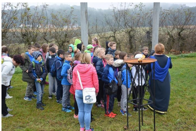
Slika 33: Spoznavanje rimskega politeizma in bajeslovnosti. (Vir: https://www.olgica.si/2019/10/16/tehniski-dan-1-9/ ).