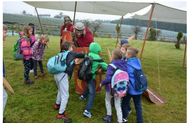
Slika 31: Učenci med mečevanjem.