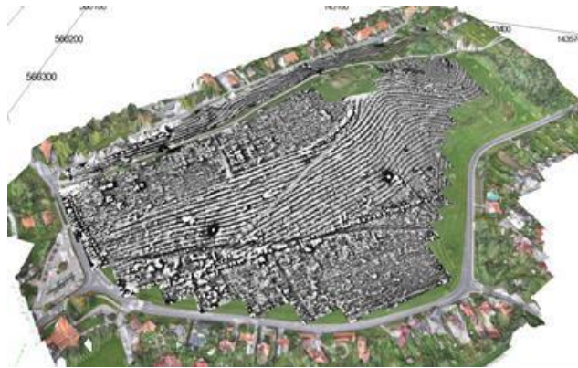
Slika 12: Park Panorama. (Vir: http://www.ptuj.si/pdf/park_panorama.pdf ).

Orfejev spomenik stoji na Slovenskem trgu v mestu Ptuj. Marmorni nagrobnik so postavili v 2. stoletju mestnemu županu Marku Valeriju Veru v takratni rimski provinci Gornji Panoniji. Visok je 5 metrov in širok 1,8 metra.