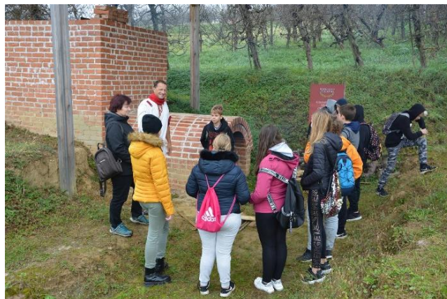
Slika 45: Prikaz opekarstva ob zakurjeni rimski peči.