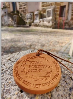
Slika 2: Žig.