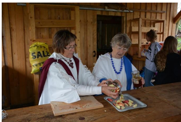
Slika 28: Vestalke iz Hajdine pri pripravi malice..

Delavnica je bila namenjena vsem učencem šole. Učenci smo se poučili, kaj so Rimljani jedli ob posameznih obrokih. Tako smo ugotovili, da se marsikatera sestavina ali celo jed iz rimskih časov najde tudi v današnji kuhinji. Posebej zadolženi smo bili učenci 7. b oddelka, ki smo vsem učencem šole pripravili in postregli malico. Pomagale so nam vestalke iz Hajdine, ki so pripravile jabolka, oblita z medom, po katerem je bila tako rekoč poznana rimska kuhinja. Ta delavnica je potekala v rimski kuhinji.