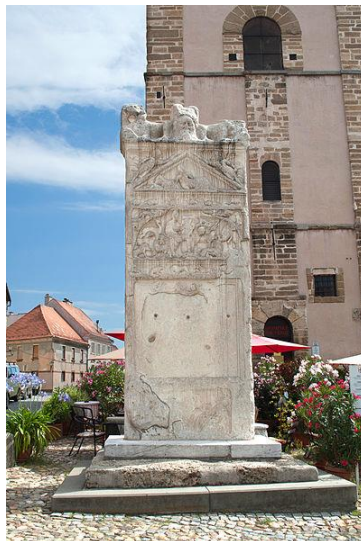
Slika 13: Orfejev spomenik na Slovenskem trgu. (Vir: https://sl.m.wikipedia.org/wiki/Slika:Ptuj_-_Orfejev_spomenik_1.jpg ).

Orfejev spomenik stoji na Slovenskem trgu v mestu Ptuj. Marmorni nagrobnik so postavili v 2. stoletju mestnemu županu Marku Valeriju Veru v takratni rimski provinci Gornji Panoniji. Visok je 5 metrov in širok 1,8 metra.