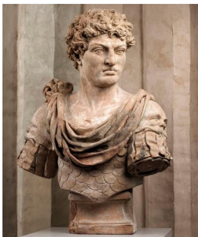
Slika 15: Markus Antonius Primus.