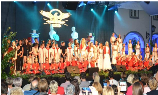
Slika 7: Premiera muzikala Poetovio (Minoritski samostan Ptuj).