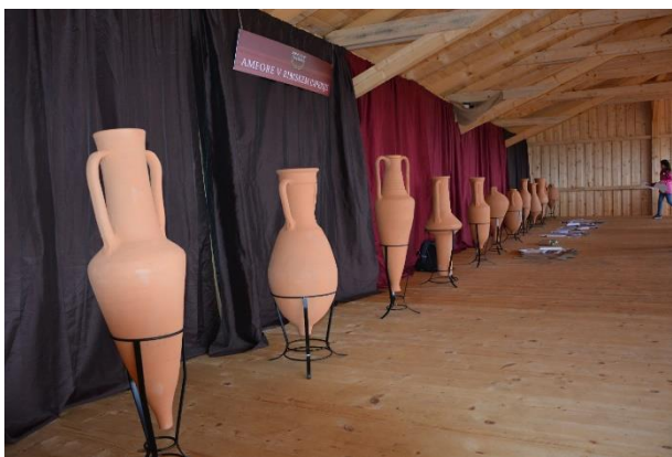
Slika 27: Stalna in največja razstava replik rimskih amfor v Sloveniji. (Vir: https://www.olgica.si/2019/10/16/tehniski-dan-1-9/ ).