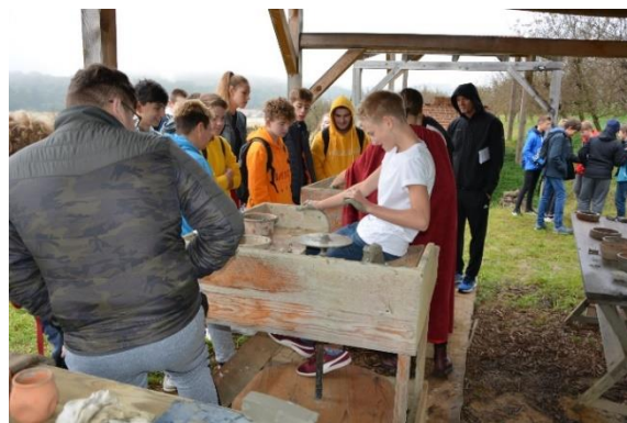
Sliki 21 in 22: Izdelava amfor, oljenk in druge posode iz gline. (Vir: https://www.olgica.si/2019/10/16/tehniski-dan-1-9/ ).