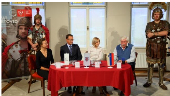
Slika 9: Predstavitve knjige Rimska vojska v republiki in cesarstvu ter rimski vojaški nagrobniki iz Petovione .