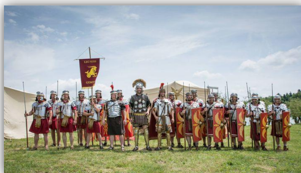
Slika 4: Rimski tabor.

(Vir: https://discoverptuj.eu/dogodki/event/ptujske-rimske-igre-2019/ ).