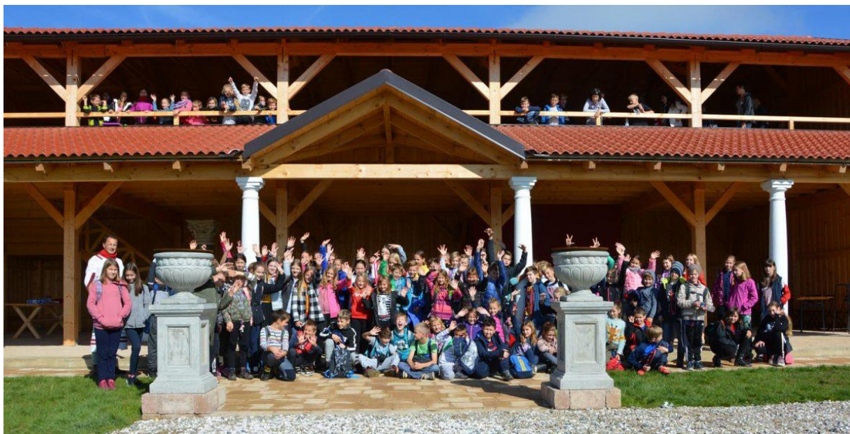
Slika 46: Zadovoljstvo v naših očeh ob zaključku eksperimentalnega rimskega kampa. (Vir: https://www.olgica.si/2019/10/16/tehniski-dan-1-9/ ).