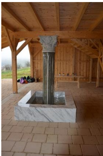
Slika 36: Fontana v notranjosti domusa.