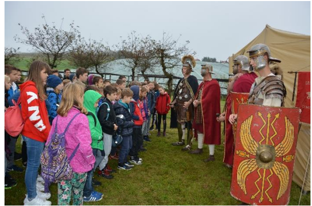
Sliki 29 in 30: Rimski vojaki med predstavitvijo bojevanja.

Nekateri učenci so se lahko pomerili v mečevanju (za zabavo seveda in z lesenimi meči). Učencem je bilo najbolj všeč prav dostopnost vojakov, saj so se jih lahko dotaknili, prijeli za ščit, kožuh idr.