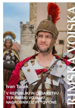
Slika 10: Knjiga Rimska vojska v republiki in cesarstvu ter rimski vojaški nagrobniki iz Petovione .