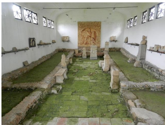
Slika 14: Ostanki III. mitreja na Ptuju.