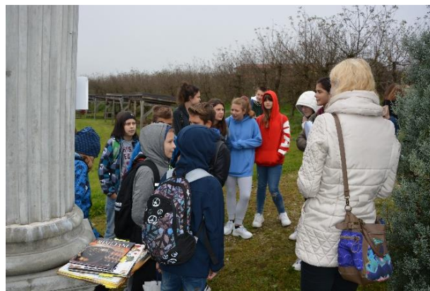
Sliki 34 in 35: Spoznavanje rimske arhitekture in gradbeništvu.