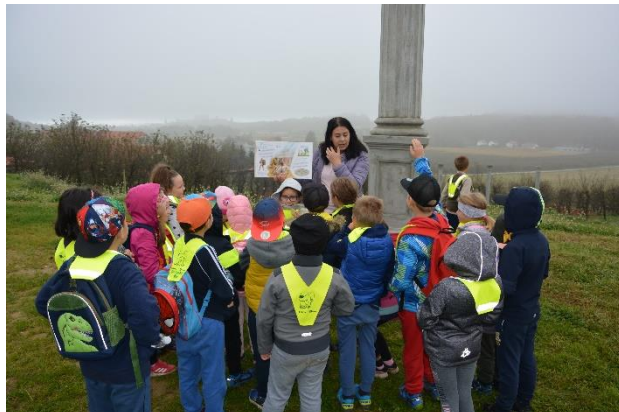
Sliki 37 in 38: Spoznavanje rimskih pravljic.