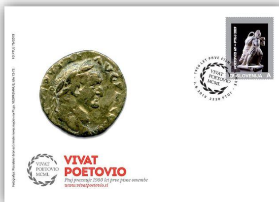
Slika 3: Kuverta in osebna znamka.