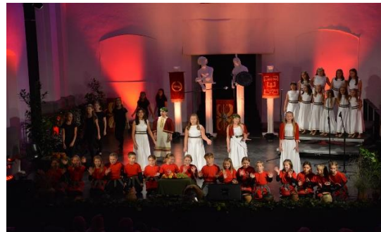
Slika 8: Ponovitev v Dominikanskem samostanu Ptuj.