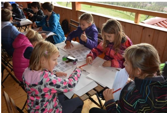
Slika 39: Učenci pišejo v latinščini.