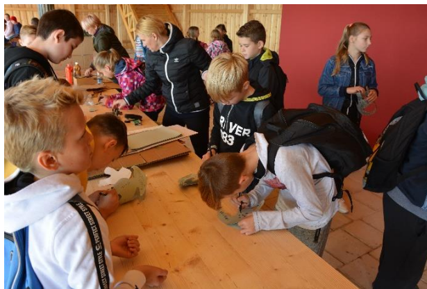
Slika 43: Izdelovanje vojakov iz kartona.

Tudi ta delavnica se je odvijala v pritličju domusa. Na voljo smo ponovno imeli mize in klopi. Vodje delavnice so nam dali na razpolago karton, škarje in barve. Izdelovali smo ščite iz kartona in jih poljubno okrasili.