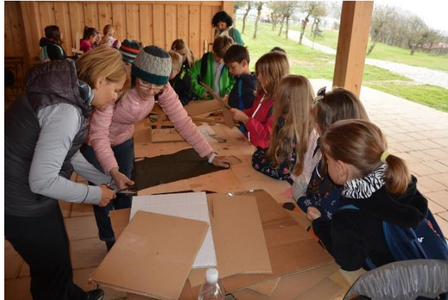
Slika 44: Izdelovanje ščitov iz kartona.