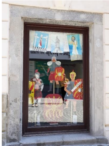
Slika 5: Razstava »Zgodbe našega mesta«. 4

(Vir: https://www.olgica.si/2019/06/08/razstava-zgodbe-nasega-mesta/ ).