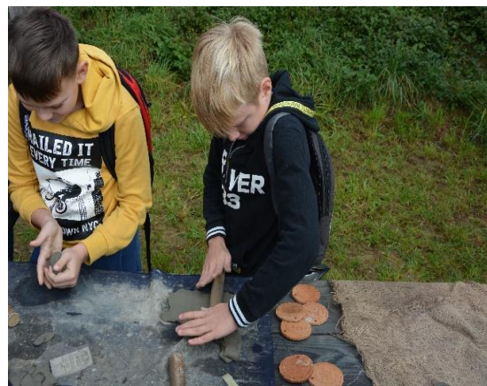
Sliki 19 in 20: Izdelava medaljonov iz gline.

Zraven medaljonov smo učenci izdelovali iz gline še najrazličnejše rimske izdelke, kot so amfore, oljenke in druge posode. Ta izdelava je potekala s pomočjo lončarskega vretena.