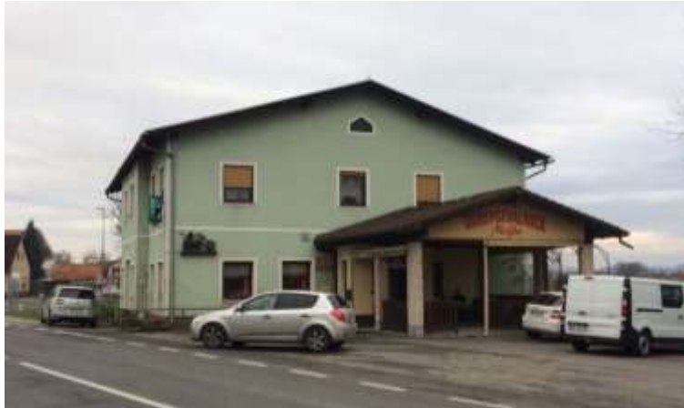
Slika 5: Okrepčevalnica Majda.

V vasi imamo tri gostilne. Najstarejša in med vaščani najbolj priljubljena je gostilna Pri Majdi. V začetku vasi iz smeri Ormoža je velika gostilna Vila Monde. Na križišču pred ovinkom, iz smeri Ptuja pa je manjši bar Sandra.