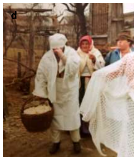
Slika 24 a - d: Maskiranje na gostiji.