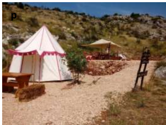
Slika 38 a - p: Tlačani na gostovanjih po tujini.