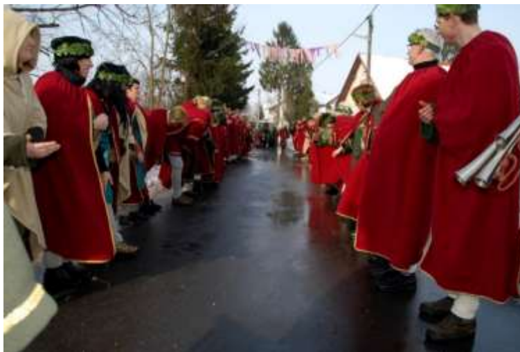
Slika 48: Rimljani v pozdravu.