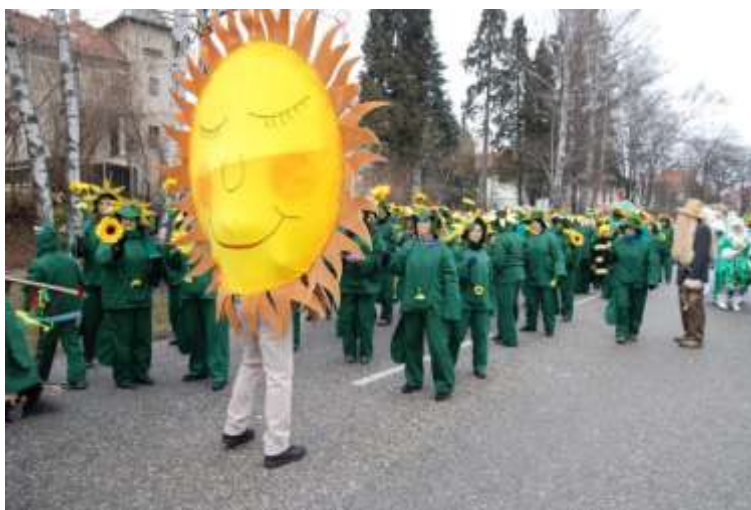
Slika 44: Sončnice s soncem na Ptuju.