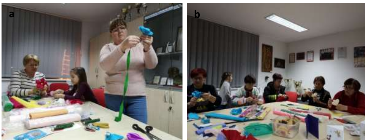
Slika 32 a - b: Izdelava rož iz papirja.

Društvo gospodinj Marjetica iz Spuhlje pripravlja različne tečaje in delavnice. V pred pustnem času vsako leto organizirajo delavnice v izdelavi rož iz krep papirja in izdelavi duhov. Delavnice so vsako leto dobro obiskane tako, da se ni bati, da bi se izdelava rož prenehala.