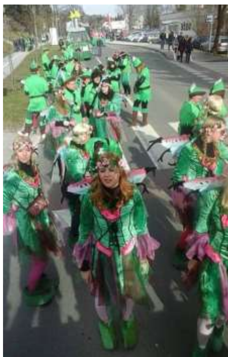
Slika 77: Peter Pan in Zvončice na Ptuj.