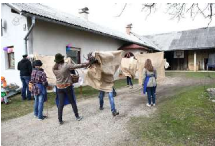
Slika 14: Male ruse.