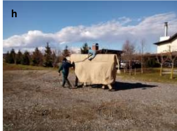
Slika 41: Spuhljanske ruse.