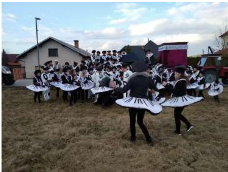
Slika 82: Simfonija klavirjev.