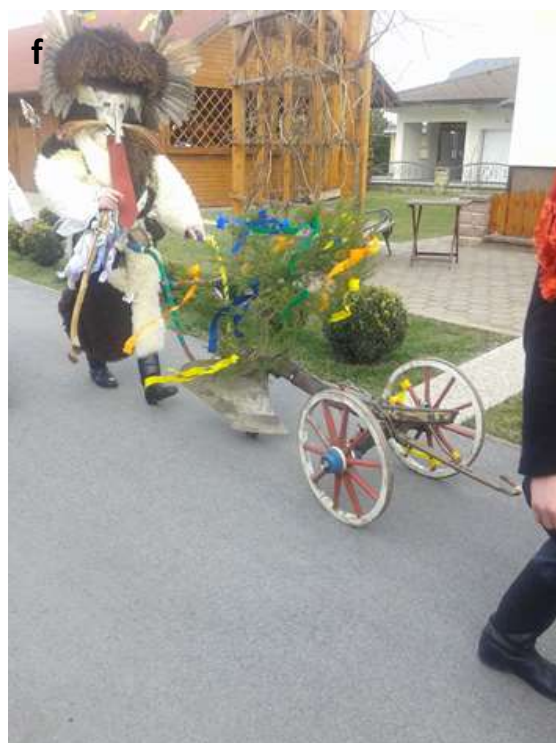
Slika 43 a - f: Orači na oranju po Spuhli.