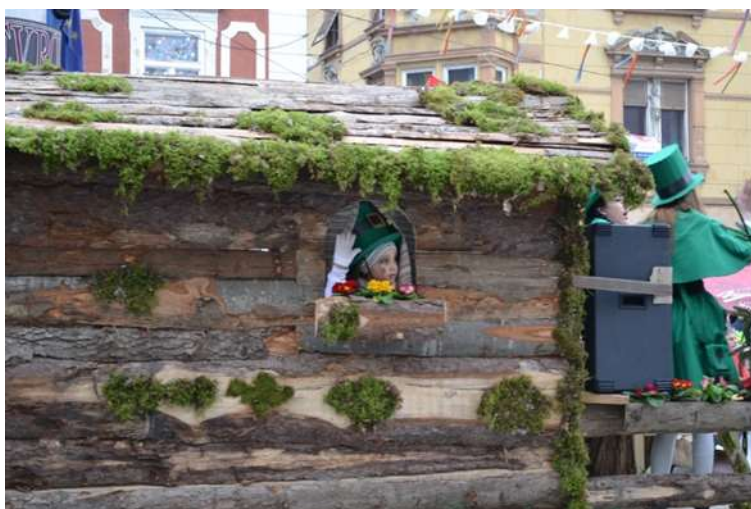
Slika 65: Vozilo irskih škratov.