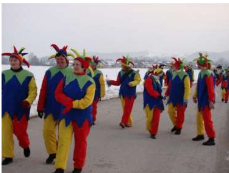
Slika 59: Dvorni norčki.