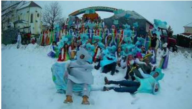
Slika 78: Mavrična fantazija.

Leta 2018 je pod vodstvom Alenke Klarič skupina predstavljala mavrično fantazijo. Skupina je štela 96 članov. Z mavričnimi barvami in modrimi oblaki so želeli pokazati, da živimo v mavrici kaosa. Da nastane mavrica, so potrebni oblaki, dež ter sonce. Ko posije sonce, se razprostire mavrična fantazija, katera je vsem vidna, je čarobna, občudovanja vredna, pa vendarle nikomur dosegljiva. Skupina se je udeležila karnevalov na Ptuj, Markovcih, Dornavi in Bukovcih. S to masko so v juniju gostovali na karnevalu na Hrvaškem v Ivanič gradu.