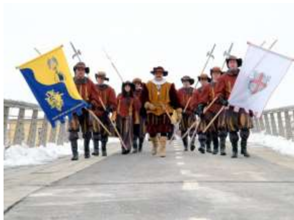
Slika 16: Princ Klinc Hauptman Spuhljanski VII z gardo.

in podložen z blagom druge barve. Imel je bogato nabrane rokave, ki so kakor hlače, iz rdečega žameta. Obut je bil v visoke škornje, za pasom je imel tanek poveljniški meč in na glavi klobuk. Njegovi vojaki (garda) so bili oblečeni v isti stil, predstavljali so vojake strelskega dvora in v rokah so imeli helebarde.