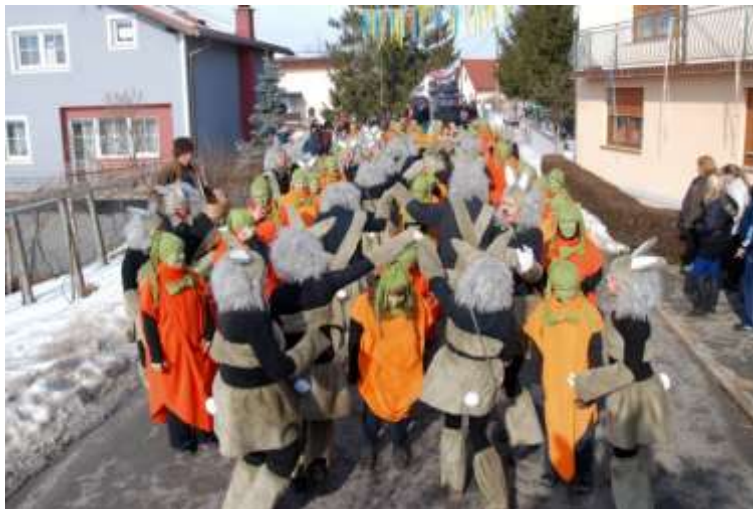
Slika 55: Zajčki in korenčki se predstavljajo.