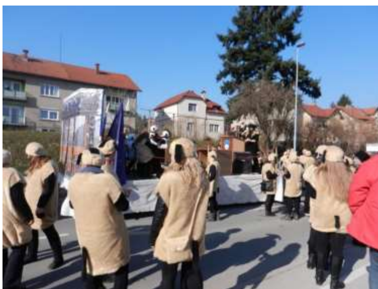
Slika 67: Ovce z vozilom.