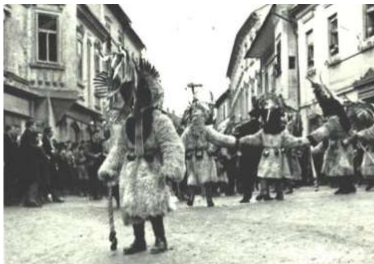
Slika 8: Ples korantov na ptujskih ulicah v letih od 1960 - 1965.