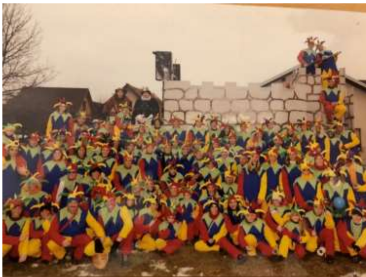
Slika 58: Skupinska slika dvornih norčkov.