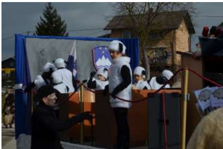
Slika 69: Mlade ovce.