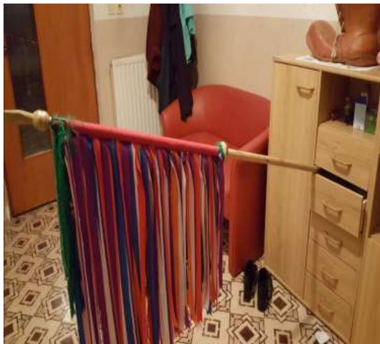
Slika 25: Kopje.

Lik kopjaša se sicer še ohranja vendar tega, kar predstavlja v veliki meri ni več. Lik kopjaša predstavljamo že od leta 1960, ko smo prvič prišli na povorko na Ptuj. Tako letos praznujemo že 60. obletnico.