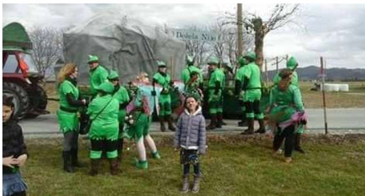
Slika 75: Peter Pan in Zvončice.