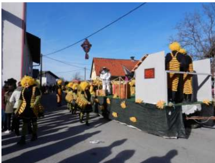
Slika 70: Čebelice na povorki v Markovcih.