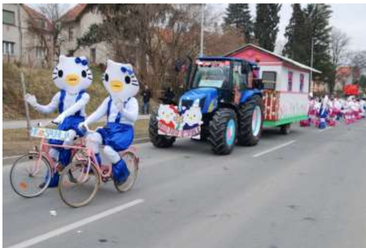
Slika 51: Hello Kitty.