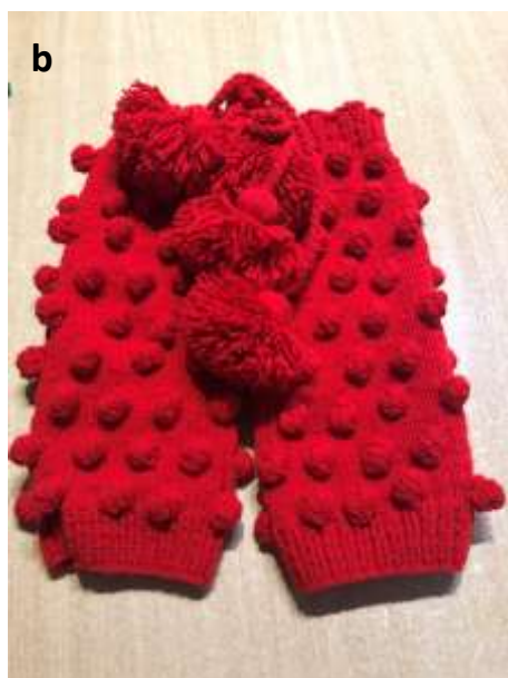
Slika 29 a - b: Gamaše, ki jih izdeluje Suzana Čeh.