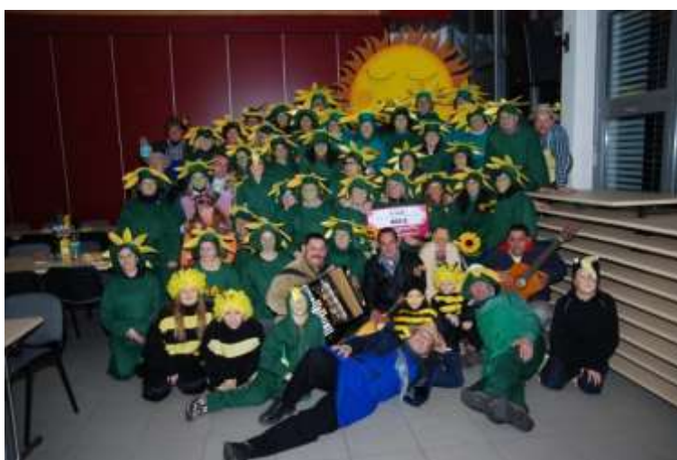
Slika 45: Sončnice s soncem – skupinska slika.