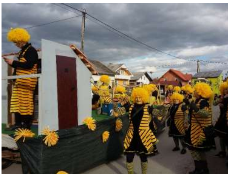
Slika 72: Čebelice ob čebelnjaku.