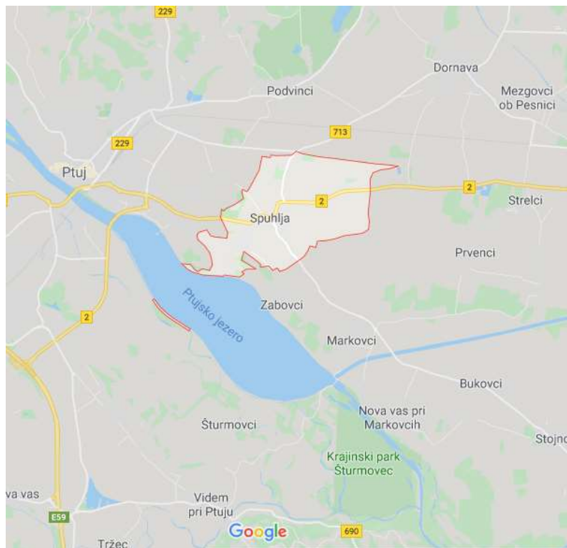
Slika 1: Lega vasi Spuhlja. (Google maps, 2020)

Spuhlja je vas, ki spada pod Mestno občino Ptuj. Po lokalni samoupravi spada v primestno Četrtno Spuhlja, ki je ena izmed četrtnih skupnosti Mestne občine Ptuj. Ostale četrtne skupnosti so: Četrtna skupnost Breg – Turnišče, Četrtna skupnost Center, Četrtna skupnost Grajena, Četrtna skupnost Jezero, Četrtna skupnost Ljudski vrt, Četrtna skupnost Panorama in Četrtna skupnost Rogoznica. Spuhlja leži v vzhodnem delu Mestne občine Ptuj. Naselje je sestavljeno iz zaselkov Zgornji konec, Siget in Koče. Vas leži na najbolj južnem delu občine Ptuj in meji na Zabovce, Borovce in Podvince.