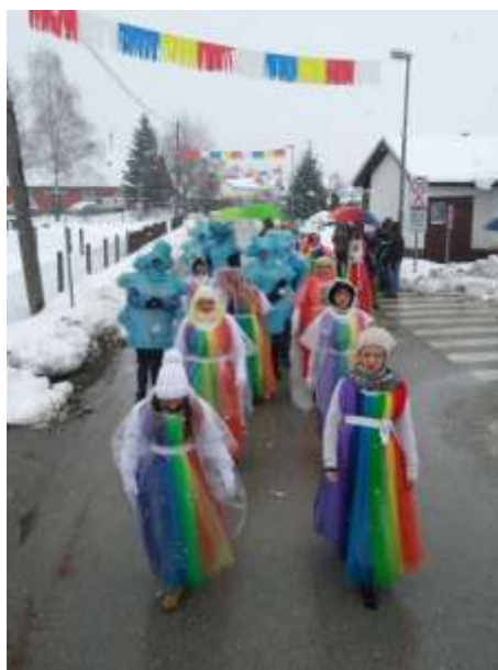
Slika 81: Mavrična fantazija v Markovcih.