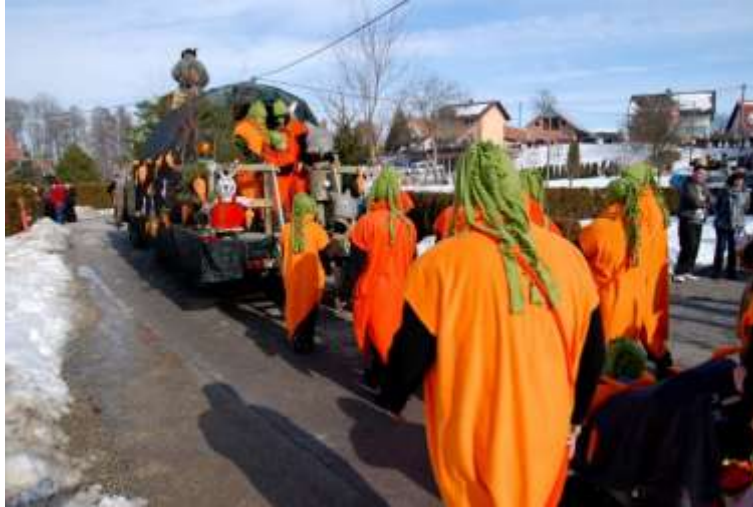
Slika 54: Vozilo z zajčki in korenčki.