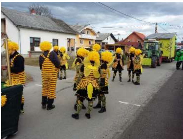
Slika 73: Čebelice.