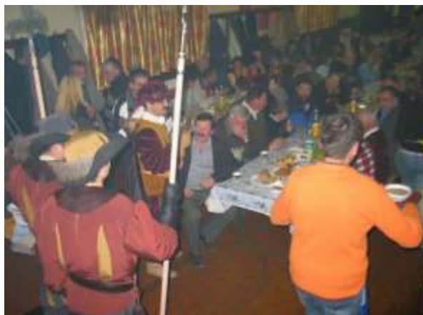
Slika 18: Pogostitev v gasilskem domu Spuhlja.