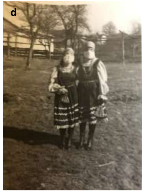
Slika 26 a - d: Maskiranje Spuhljanov nekoč.