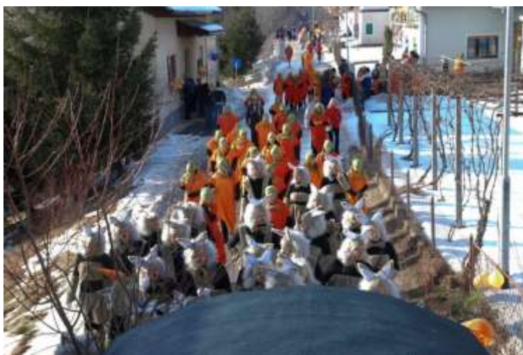
Slika 57: Zajčki in korenčki na povorki.