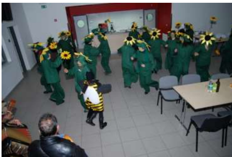
Slika 46: Sončnice s soncem na zabavi.