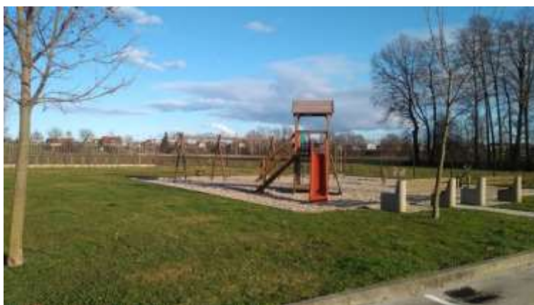
Slika 3: Otroška igrala v športnem parku Spuhlja.

V Kočah je lepo urejen športni park. V parku je urejen pokriti del za druženje in piknike, veliko asfaltirano igrišče, igrišče z mivko, steza za balinanje in otroška igrala.