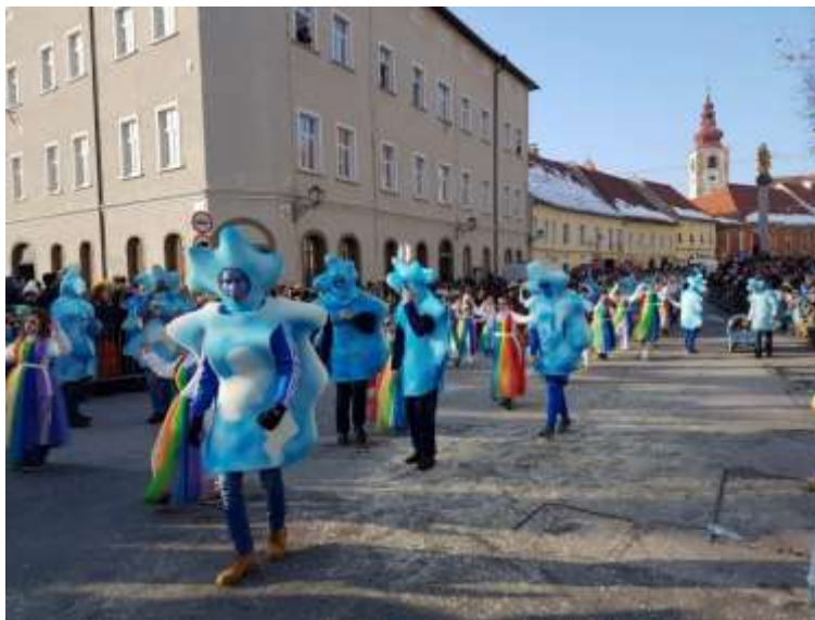
Slika 79: Mavrična fantazija na Ptujskih ulicah.