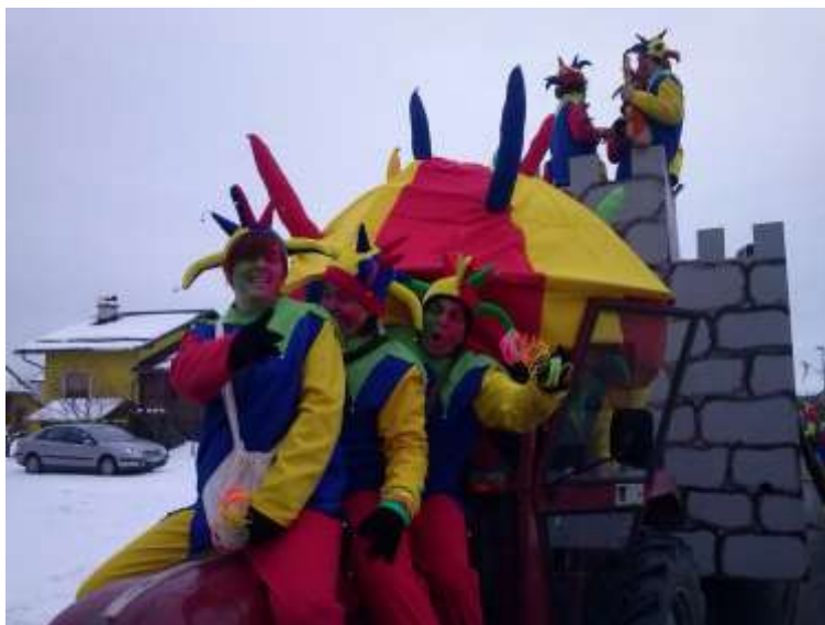
Slika 60: Dvorni norčki na vozilu.