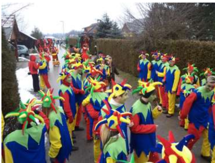
Slika 61: Dvorni norčki v Markovcih.