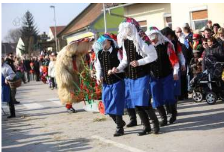
Slika 12: Orači na povorki v Markovcih.