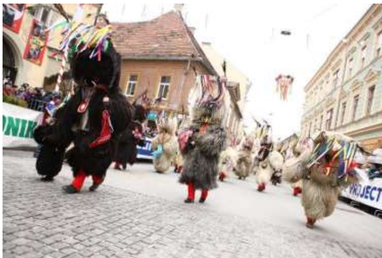
Slika 9: Skupina korantov.