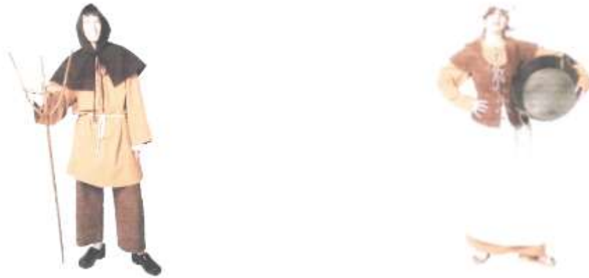
Slika 34: Idejna skica oblek za tlačane.

Tlačani pa niso aktivni samo v pustnem času, ampak delujejo čez vse leto. Redno se udeležujejo grajskih iger na Ptuju, Žužembergu in Vurbergu (Slika 37 a – f). Gostujejo tudi čez celo leto na raznih prireditvah v tujini. Tako so že udeležili prireditev v Čakovcu, Stubici in Primoštenu (Slika 38 a – p).