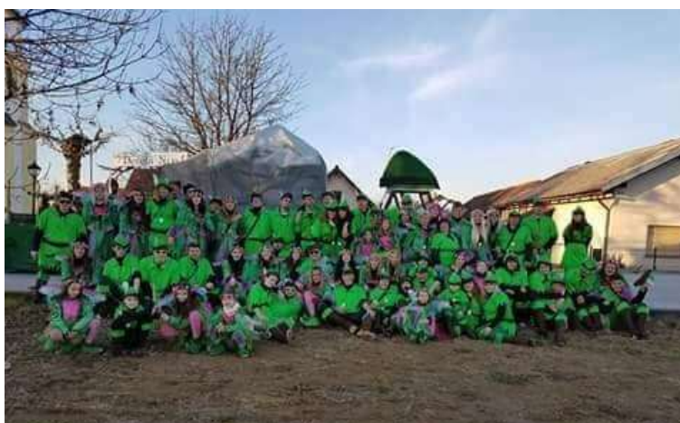
Slika 74: Peter Pan in Zvončice – skupinska slika.