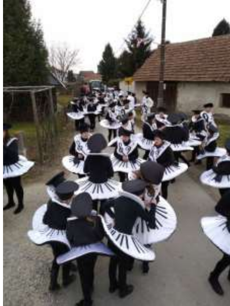
Slika 85: Simfonija klavirjev s predstavitvijo.