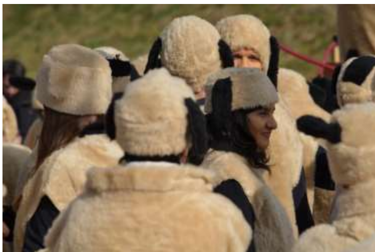
Slika 68: Ovce.