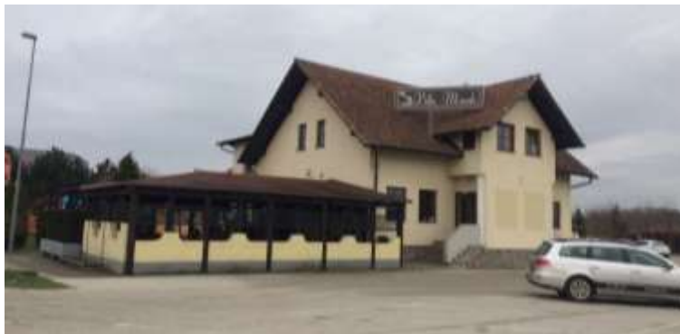
Slika 6: Gostila Villa Monde.