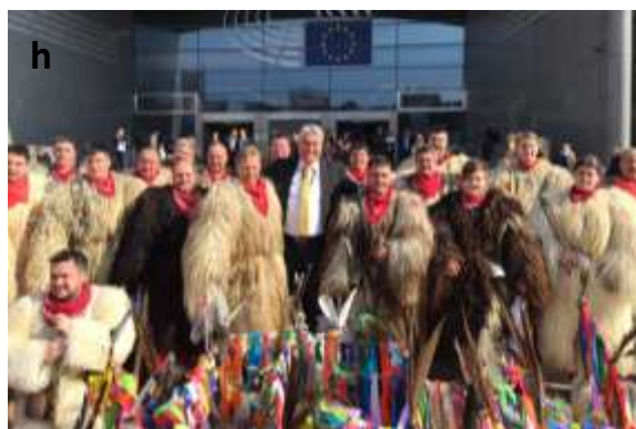
Slika 39 a - h: Koranti iz Spuhlje.