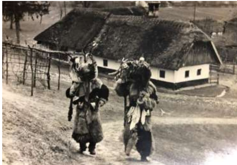
Slika 23: Koranta.