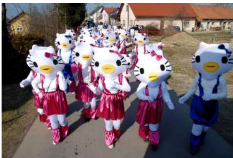
Slika 53: Hello Kitty na povorki v Markovcih. (Foto: Bojan Šel, 2011)