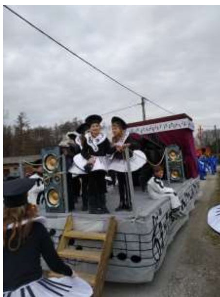
Slika 84: Simfonija klavirjev z vozilom.