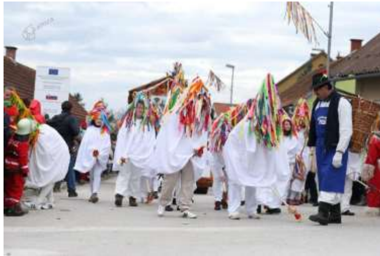
Slika 10: Piceki na pustni prireditvi v Markovcih.

Tako piceka kot kuro spremlja pobirač , fant oblečen v odraslega moškega. Nosi stare hlače, srajco, suknjič, moder predpasnik in klobuk, obraz pa ima zakrit s papirnatim naličjem. V rokah ima košaro s plevelom in semenom ter grablje. Na kmečkem dvorišču zapojejo in zaplešejo, voščijo srečo in dobro nesnost pri kokoših, posejejo seme za dobro letino na vrtu in poberejo darove. (Zmazek, 2014)