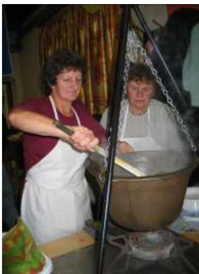
Slika 19: Pogostitev pripravile Marjetice iz Spuhlje.