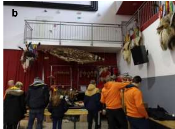
Slika 40 a - b: Sejem korantove opreme.