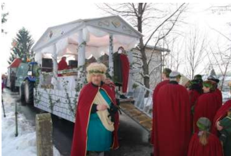
Slika 50: Vozilo Rimljanov.