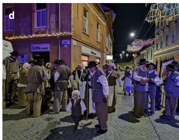
Slika 36 a - d: Tlačani na etnografskem nastopu na mestnih ulicah.