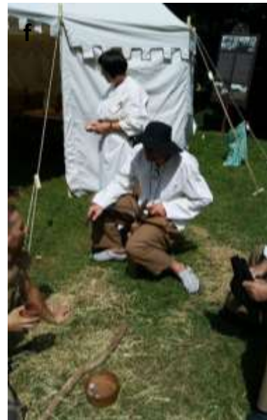
Slika 37 a - f: Tlačani na Grajskih igrah na Ptuj, Vurberku in Žužemberku.