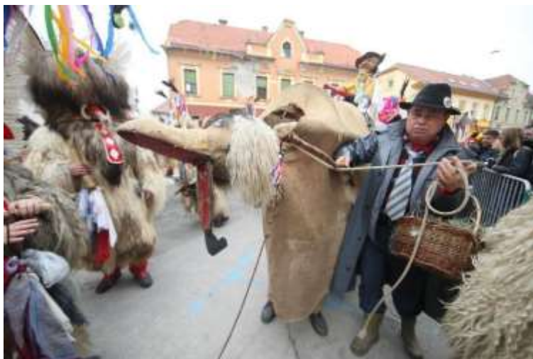
Slika 13: Rusa in gonjač.

do hiše. Ima jo na prodaj, zato je povsod veliko barantanja, a kupčija se pri vsaki hiši razdre. Domači jih povsod radi sprejmejo in pogostijo. (Zmazek, 2014)