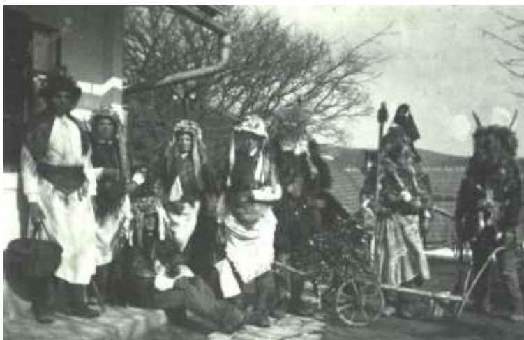
Slika 11: Orači v Halozah, 1928.