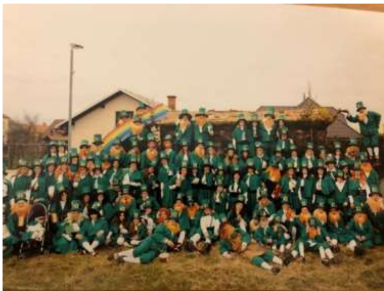
Slika 62: Irski škrtati.