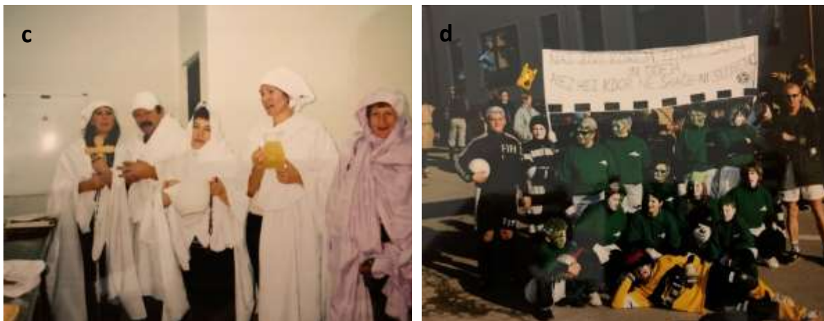
Slika 27 a - d: Maskiranje skupin.