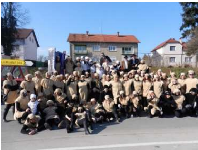
Slika 66: Ovce pred pričetkom povorke na Ptuju.