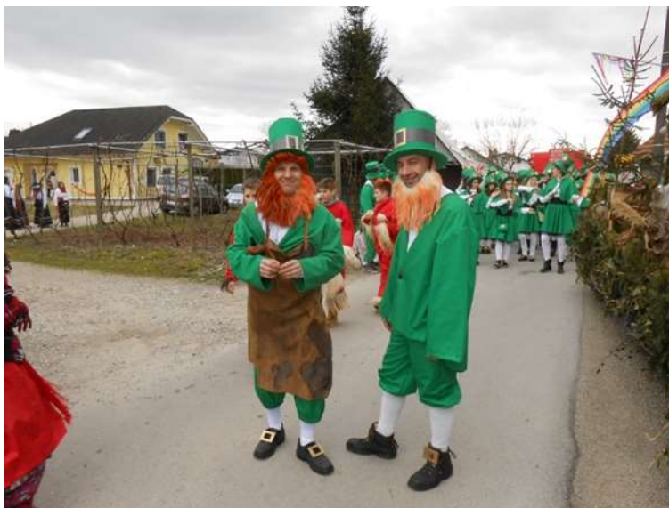
Slika 64: Irski škрати na povorki.