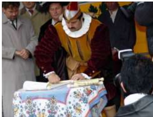
Slika 17: Pečatenje z zlatim prstanom in voskom.