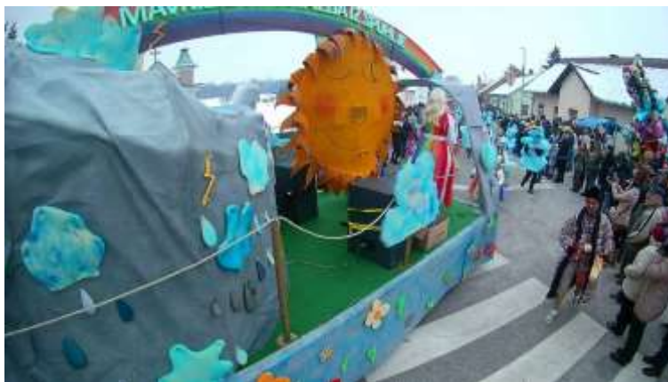
Slika 80: Mavrična fantazija z vozilom.