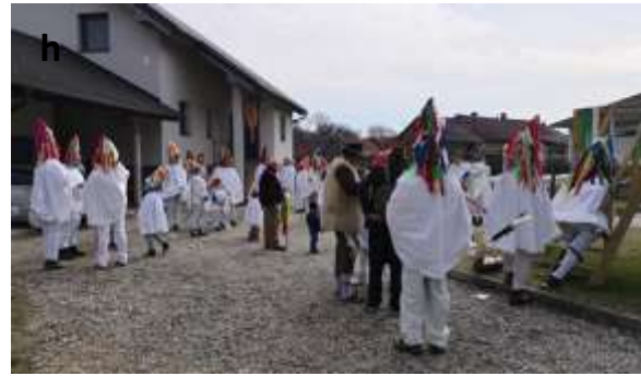
Slika 42 a - h: Obhod picekov po Spuhlji.