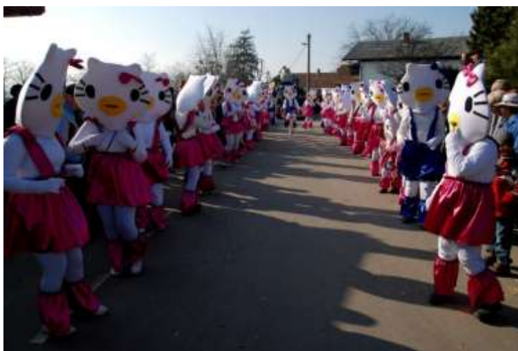
Slika 52: Hello Kitty se predstavlja.