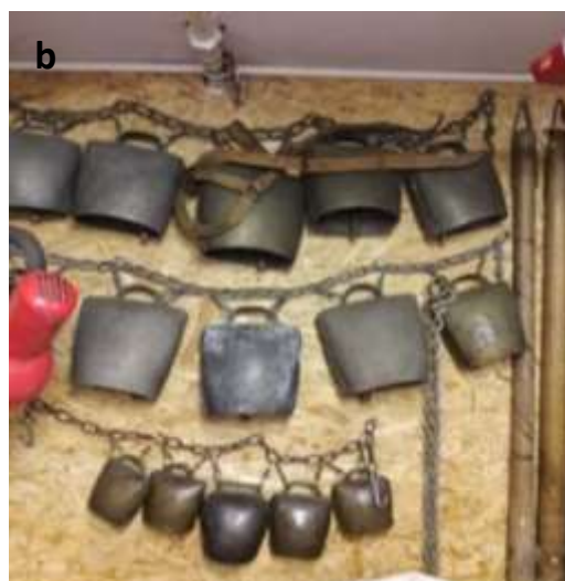
Slika 30 a - b: Franci Cimerman v delavnici.