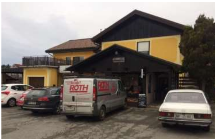
Slika 7: Bar Sandra.