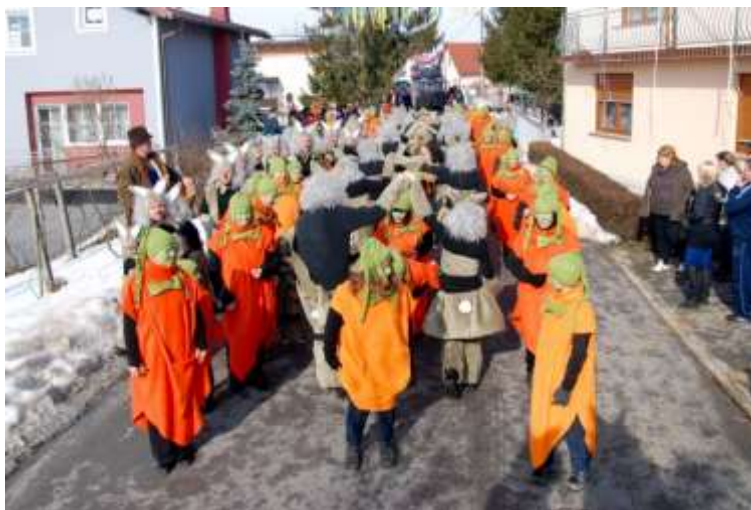
Slika 56: Zajčki in korenčki.