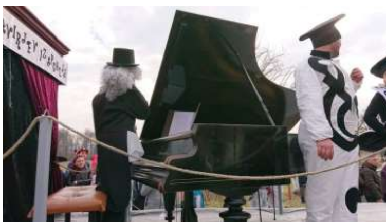
Slika 83: Klavir simfonije klavirjev.