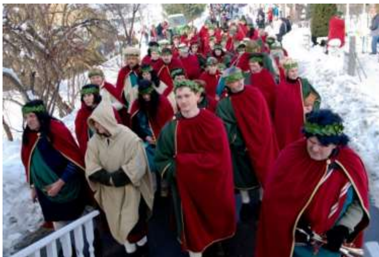
Slika 49: Rimljani na povorki v Markovcih. (Foto: Bojan Šel, 2010)