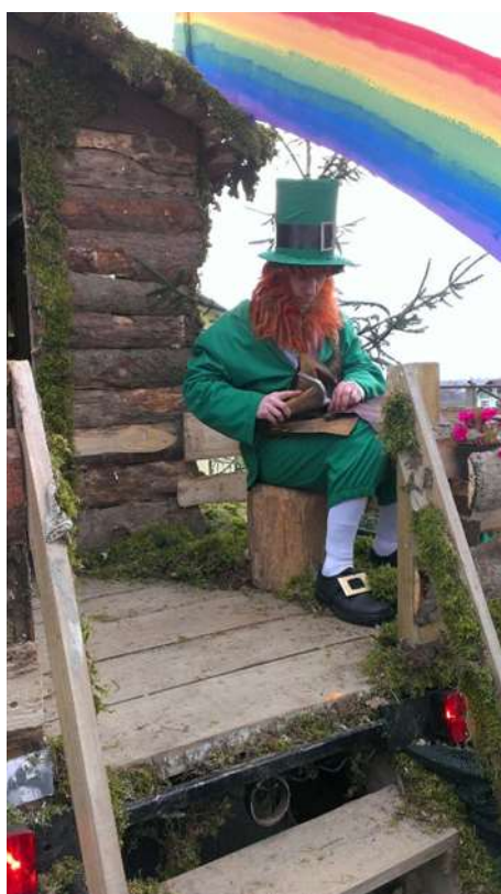
Slika 63: Irski škrtat.