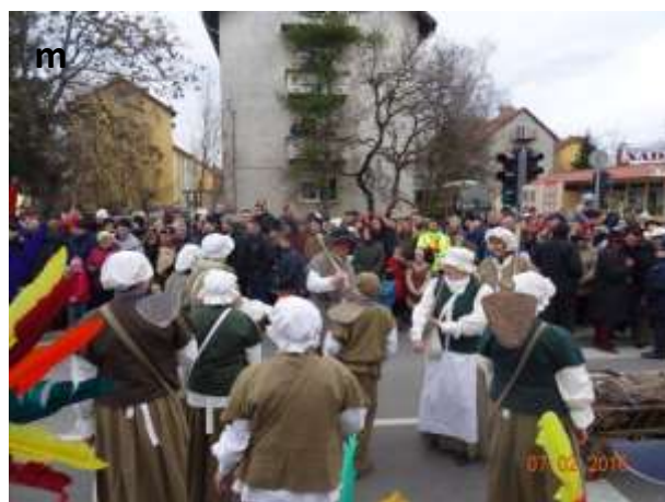
Slika 35 a - m: Tlačani na karnevalih na Ptuju in v Markovcih.