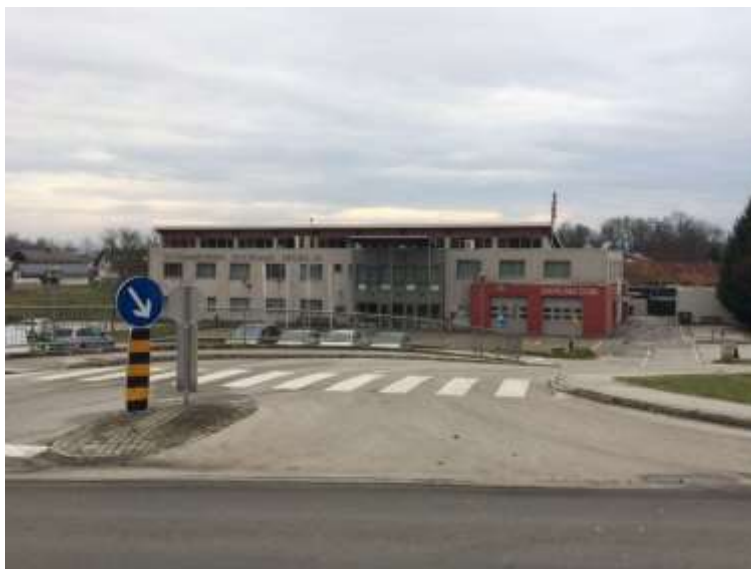
Slika 2: Večnamenska dvorana Spuhlja.

V Kočah je lepo urejen športni park. V parku je urejen pokriti del za druženje in piknike, veliko asfaltirano igrišče, igrišče z mivko, steza za balinanje in otroška igrala.