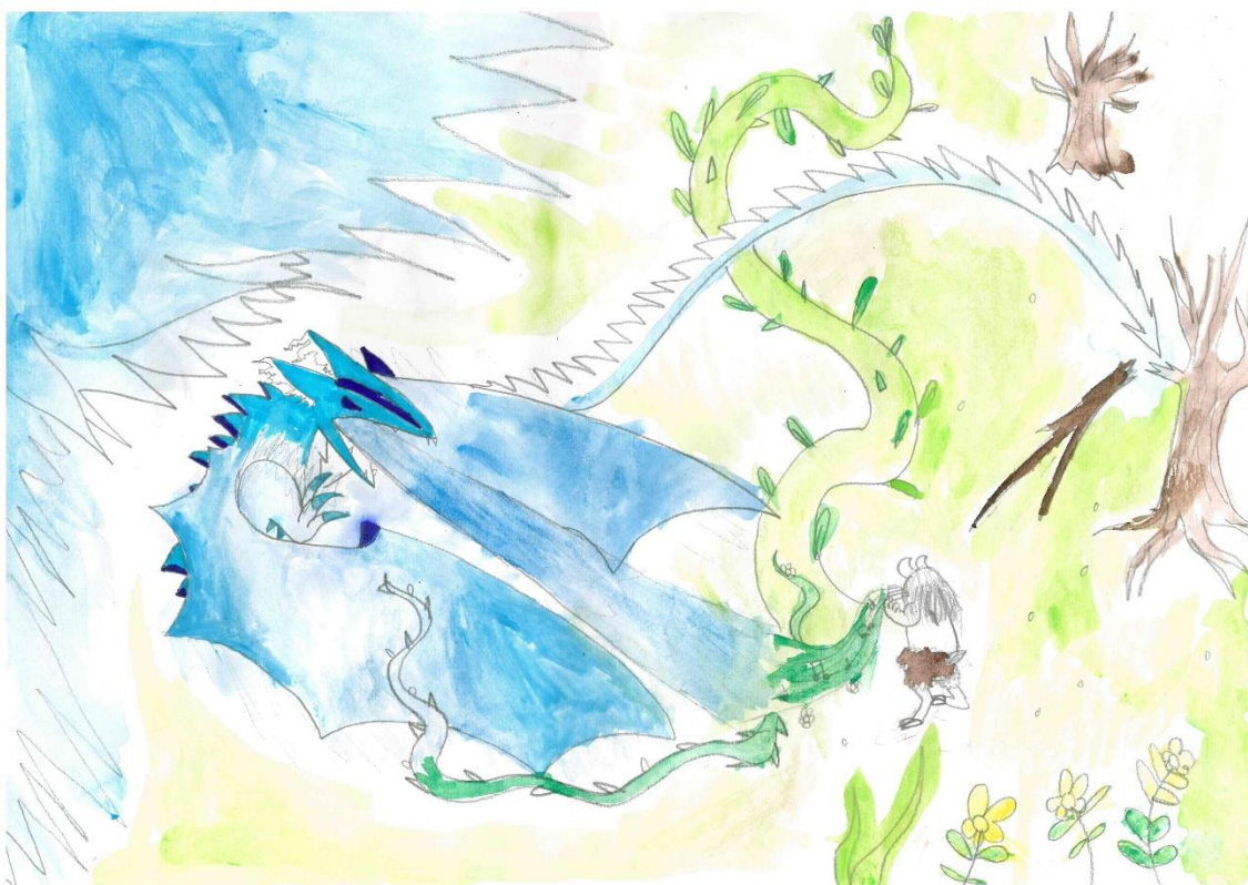
Slika 2: Boj med življenjem in smrtjo.