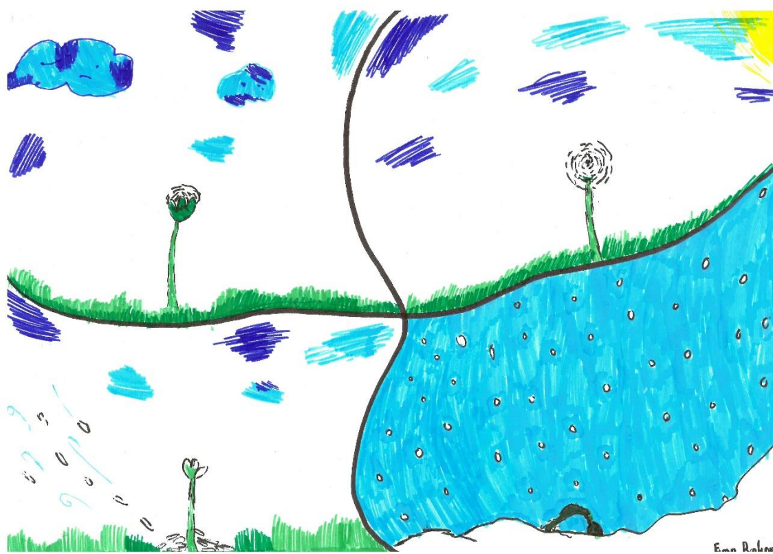
Slika 9: Štirje letni časi. (Rakovič, 2020)