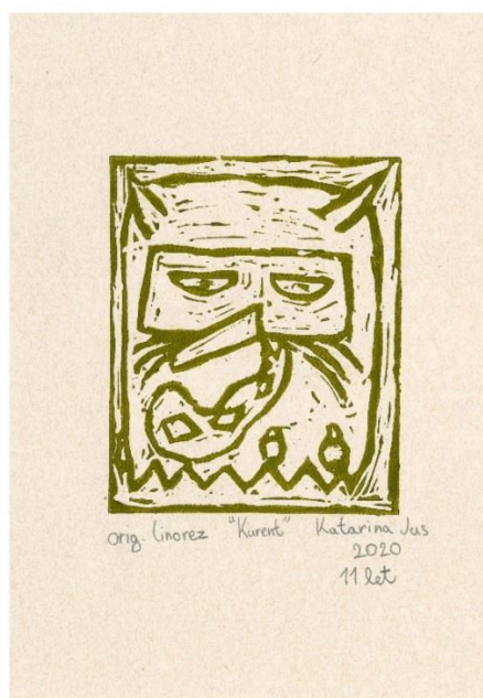
Slika 6: (a) Kurent. (Gašparič, 2020) (b) Kurent. (Jus, 2020)