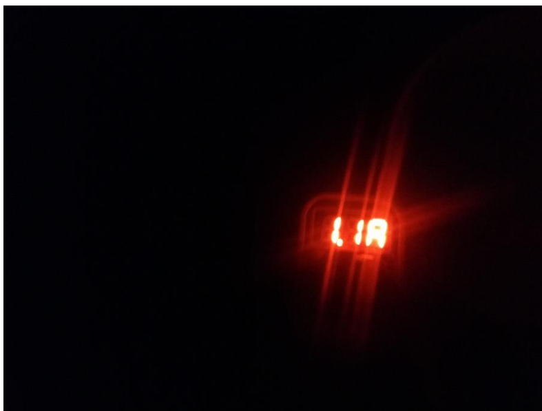
Slika 7: Stiki iz onostranstva. (Gajšek, 2019)