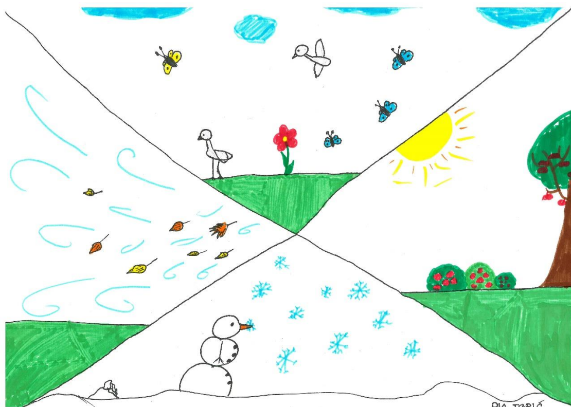
Slika 8: Štirje letni časi. (Topič, 2020)