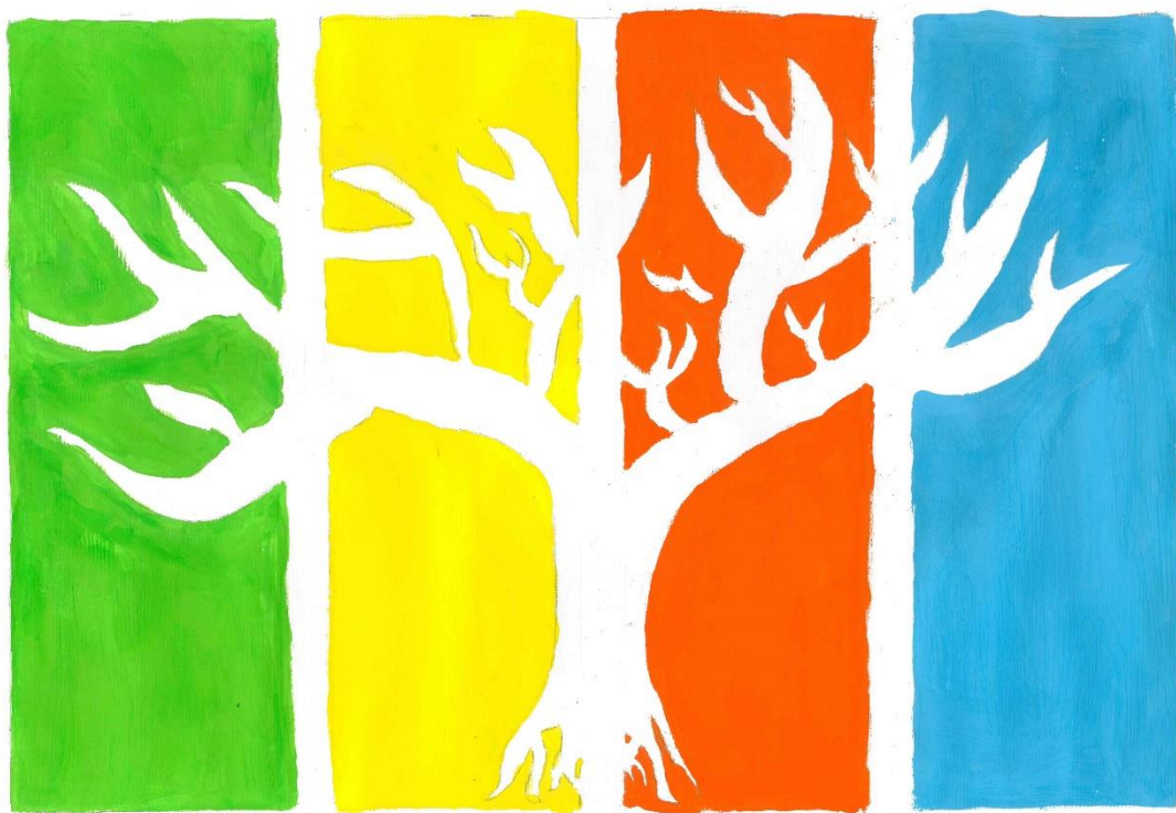
Slika 1: Štirje letni časi. (Majcenovič, 2020)