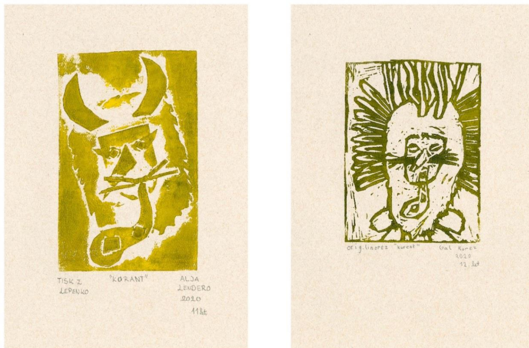
Slika 3: (a) Korant. (Lendero, 2020) (b) Kurent. (Korez, 2020).

Med bajeslovnimi bitji, ki ga povezujemo z življenjem in smrtjo, je tudi Kurent, ki je bil sprva omenjen kot bog veselja in vina. Poleg te omembe pa ga omenjajo tudi kot mitološko bitje, ki s svojim čarobnim glasbilom ljudi prepričuje k plesu. Vse te vloge ga povezujejo tudi z zavetnikom življenjske vedrosti. Zimo preganja s pomočjo plesa in trušča ter tako prebuja naravo. V nekaterih pripovedkah je hkrati godec in močan kovač, ki ukane smrt in pride v nebesa (Hudovernik, 2012; Milošič in Hertiš, 2016).