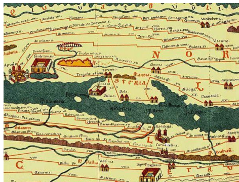
Reka Drava in prikazan takrajšnji Poetovio

Ptuj je mesto in središče mestne občine Ptuj. Sam se imenuje najstarejše mesto v Sloveniji. Območje mesta je bilo poseljeno že v pozni kameni dobi, v antiki se je iz vojaškega tabora v prvem stoletju razvila rimska utrdba Poetovio. Srednjeveški del mesta se je naslonil na vznožje Grajskega griča. Mimo Ptuja je potekal tudi zgodovinsko pomemben prehod čez Dravo, kjer je potekala trgovska pot med Baltskim in Jadranskim morjem imenovana Jantarska pot.