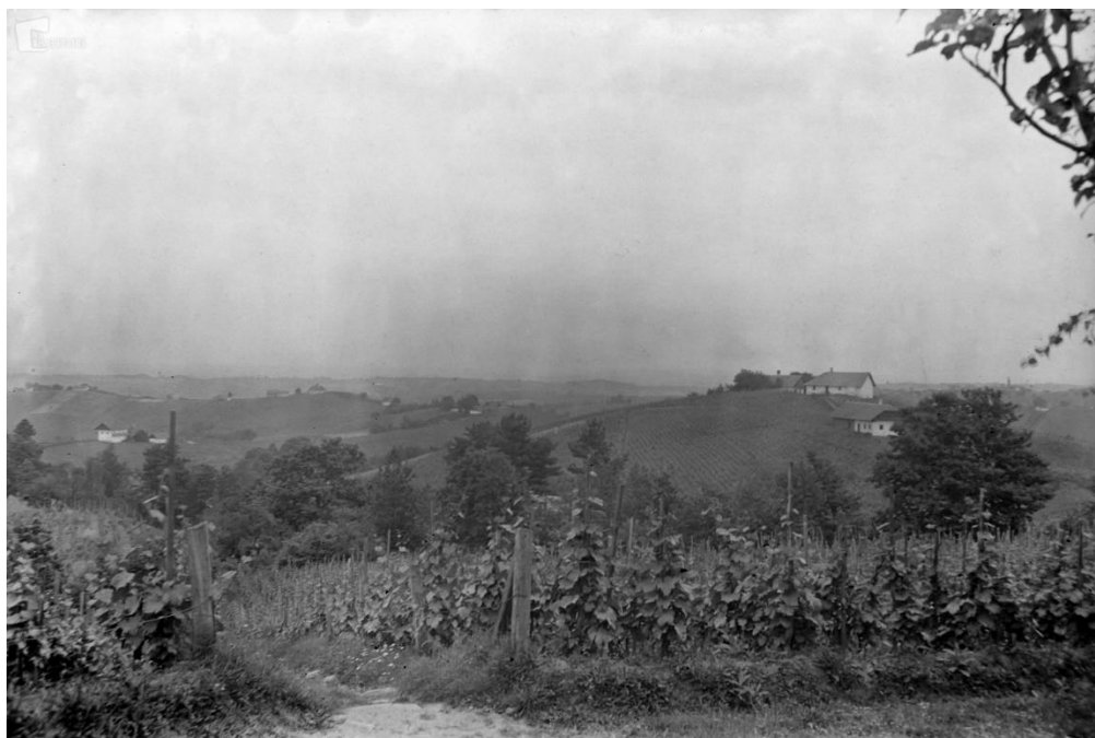
Slika 5: Slovenske Gorice, pogled od Jeruzalema proti severu, 12. 6. 1931