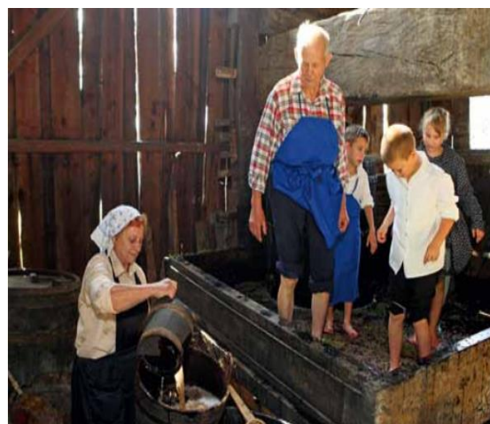
Slika 4: Stiskanje grozdja.