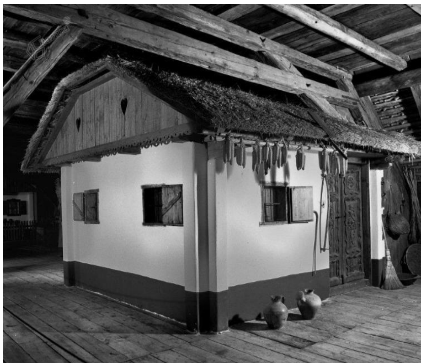
Slika 3: Na fotografiji je viničarska hišica, ki so jo postavili na podstrešju ptujske grajske žitnice iz zbirke Maske (življenje kmeta in viničarja). Postavljena v leto 1978