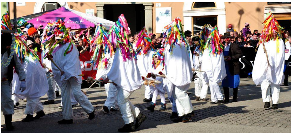
Slika 5: Piceki (karneval na Ptuj)

V piceka so se šemili mlajši šolarji. Pod pazduho si je zavezal materino ali sestrično belo spodnje krilo, zgoraj je imel oblečeno belo srajco, na glavi pa je nosil kapo iz belega papirja. Obraz mu je prekrivalo papirnato naličje. Po navadi je zajahal leseno palico, na kateri je bil na spodnjem delu navezan šop kurjih peres, na zgornjem delu pa je bila prava petelinova glava.