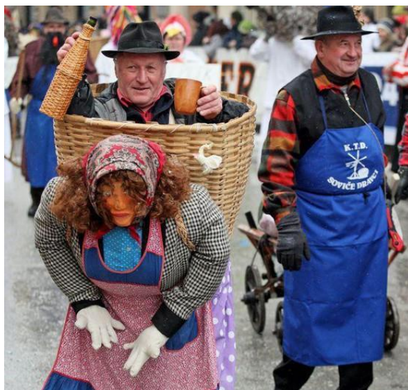
Slika 4: Baba deda nosi (karneval na Ptuj).