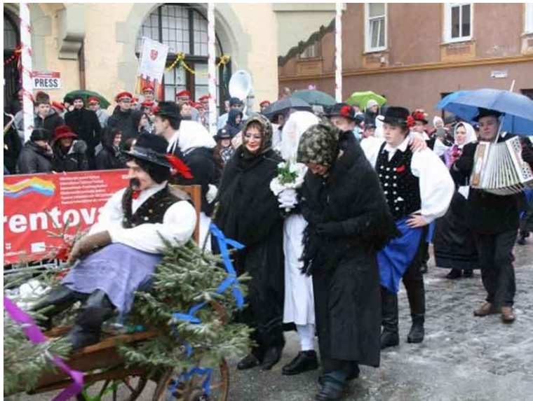
Slika 6: Ploharji (karneval na Ptuju)

Vleko ploha, povezujemo s starim obredom čaranja plodnosti. Kadar se v predpustnem času ni omožilo nobeno dekle iz vasi, so fantje priredili vleko ploha, borovega debla. Danes pri tem sodelujejo tudi dekleta. Na čelu spreveda so muzikant in drug z družico. Trije pari deklet vlečejo okrašen ploh. Na njem je pritrjen stol, na katerem sedi slamnata lutka, ki predstavlja ženina. Zadaj stopajo nevesta, črne babe, fantje in muzikantje. Tako hodijo po vasi in v dar dobijo hrane in pijače (Kuret, 1984, str. 206, 207, 480).