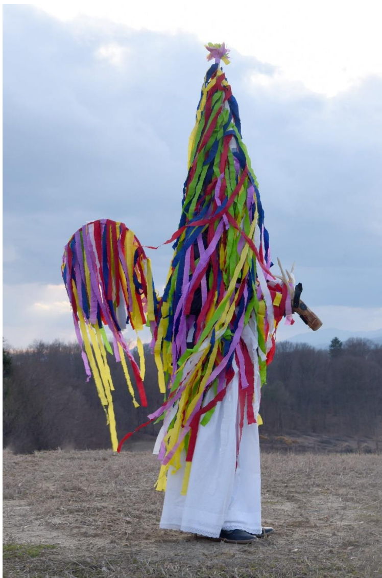
Slika 9: Podgorska mrsa (Vir: lasten, fotografija: Karin Hrga, 2017)

Ker je podgorska mrsa posebnost našega raziskovalnega območja in nam od informatorjev ni uspelo pridobiti nobenih fotografij pustnega lika, smo se odločili, da jo bomo po opisu informatorjev izdelali. Informator Jože Petek se je prijazno ponudil, da nam bo pomagal pri izdelavi mrse za potrebe raziskovalne naloge. Pripravil je ves potreben material. Povedal je, da je nekaj materiala sodobnejšega, kot ga je uporabljal pri izdelavi nekoč in je z njim lažje delati, zato se je odločil zanj.