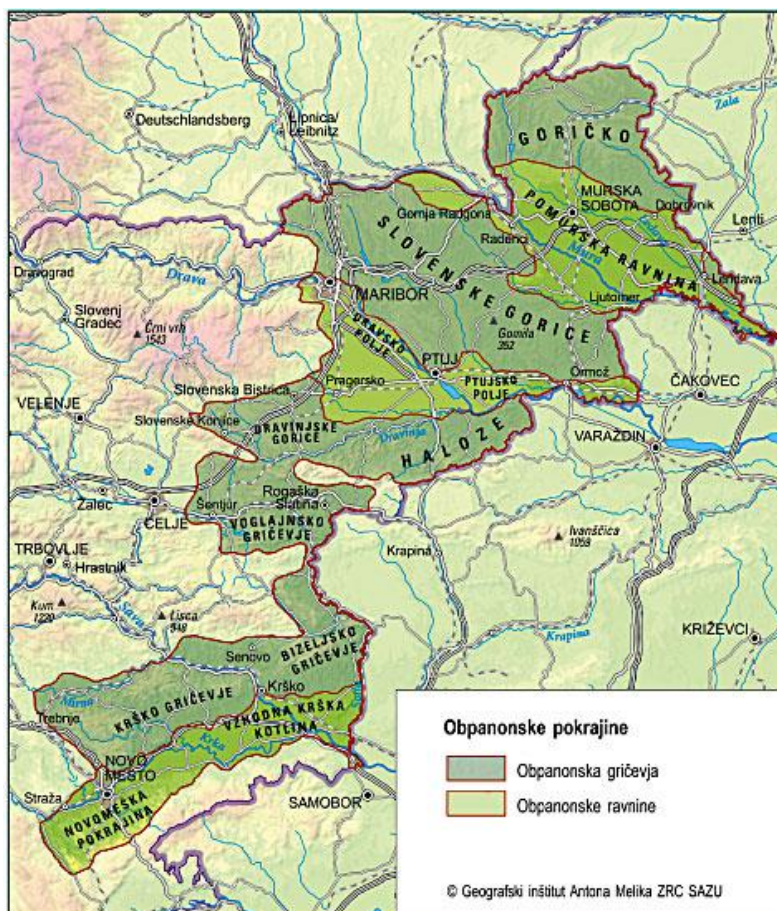
Slika 7: Zemljevid obpanonskih pokrajin

Ptujsko polje velja za tradicionalno šemsko območje Slovenije, prav zaradi koranta ali kurenta . V še posebej pustno razvite kraje, z bogato tradicijo šemljenja in pustovanja na območju Ptujkega polja in Haloze spadajo še: Markovci, Zabovci, Borovci, Prvenci, Stojnci, Nova vas, Sobotinci, Strelci, Bukovci in bližnje vasi kot so Spuhlja, Dornava, Moškanjci. Čeprav ležijo Podgorci na obrobju korentove avtohtone domovine, je pustovanje v preteklosti na tem območju imelo velik pomen, pa tudi pustni lik korenta je bil v celoti sprejet tudi v teh krajih.