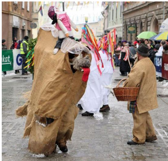
Slika 3: Rusa s ptujskega karnevala (2010).

Na ptujskem polju jo imenujejo tudi »mela« ali »melika«. V ruso se našemita dva fanta z ogrođjem, ki ga nosita na ramenih in ga do tal prekriva plahta, da se vidijo samo noge. Ogrodje velike ruse je dolgo 300, široko 41 in visoko kar 43 centimetrov. Izdelano je iz dveh prečnih in podolžnih lesenih tramičev, ki sta povezana z loki iz armaturnega železa. Na hrbtu je pritrjen okrog 80 centimetrov velik jezdec, narejen iz natlačenih otroških oblačil, ki predstavlja navadno Turka. Skozi odprtino prvi fant moli rusino leseno glavo, ki premika spodnjo čeljust. Zadaj je obešen pravi kravji rep. S trupom glavo veže kar 70 cm dolg vrat, na katerem je 34 centimetrov velika glava. Izdelana je iz lesa, oblepljena je z ovčjo kožo. Pokončna ušesa so iz trde gume, v gobcu pa ima rdeč jezik (Brence, 2003, str. 86–87).