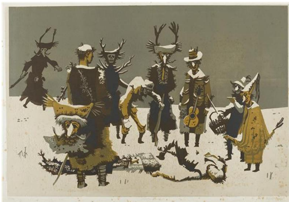
Slika 1: Mihelič France: Mrtvi kurent, 1955, barvni lesorez.